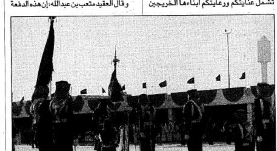
الملك خالد العسكري