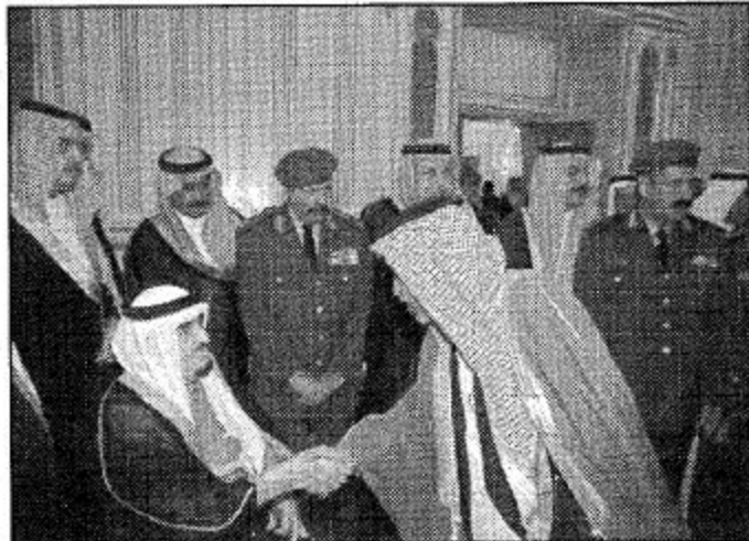
□ لقطات من استقبال خادم الحرمين الشريفين للعلماء والناشخ والوطنين