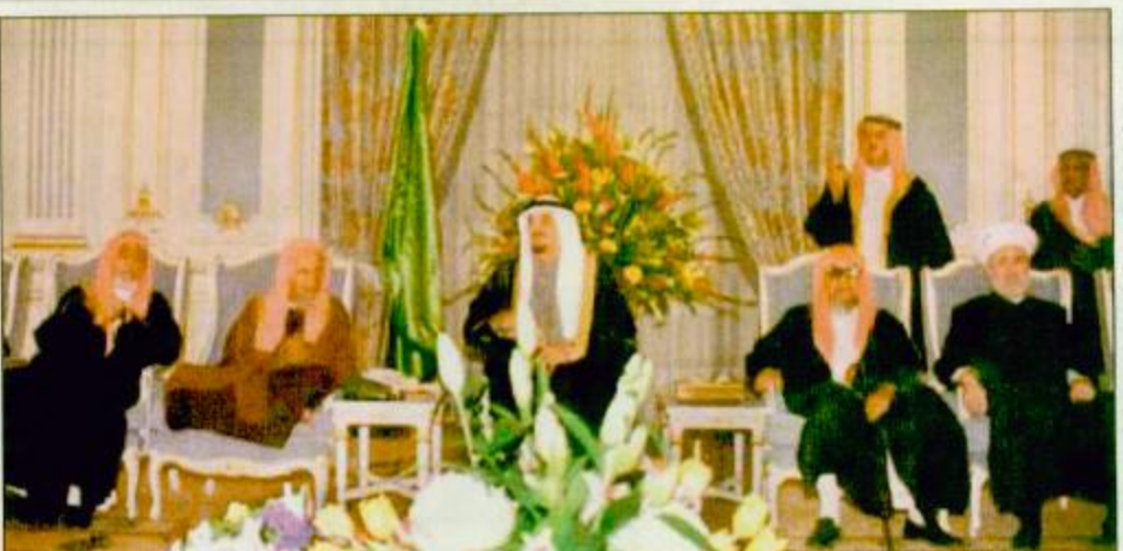
خادم الحرمين استقبال العلماء والمواطنين ومفتي لبنان □ الرياض - واس استقبل خادم الحرمين الشريفين الملك فهد بن عبدالعزيز آل سعود في الديوان الملكي بصر العمالية مساء أمس صاحب الفضيلة العلماء والشايخ كما استقبل حفلة الله جموعاً من المواطنين الذين قدموا للسلام عليه ليله الله. □ الرياض - واس استقبل خادم الحرمين الشريفين الملك فهد بن عبدالعزيز آل سعود في الديوان الملكي بصر العمالية مساء أمس مفتي لبنان في الديوان الملكي بصر العمالية مساء أمس

نيابة عن خادم الحرمين .. سمو ولي العهد يتوجه اليوم إلى أبوظبي لرئاسة وفد المملكة وسط آمال معالجة التحديات الاقتصادية والتفاعل مع المتغيرات السياسية قمة «الخير والصراحة» تبدأ اليوم في أبوظبي □ ابوظبي - موفد الجزيرة تنتقل اليوم في ابوظبي القمة التاسعة عشرة لمجلس التعاون التي تستمر ثلاثة ايام بتخامس من خلالها القادة الخليجيون مسيرة التعاون الخليجي خلال عام مضى ويبحثون في ما يتعين تنفيذه في هذه السيرة خلال الرحلة المقبلة. وتكتسب القمة التاسعة عشرة اهمية استثنائية لجملة اسباب من اهمها جملة التحديات الاقتصادية التي فرضها تدني معدلات النمو الاقتصادي في ابرز الكتل والتجمعات الاقتصادية الدولية وانخفاض أسعار البترول وتدور الازدواج الاقتصادية في عدد من الدول في جنوب قارة اسيا وقارة امريكا اللاتينية، إضافة الى التغيرات والتقلبات السياسية التي تخلف بها المنطقة العربية. وهذا ما يتطلب معالجة صريحة وعملية لذلك فان الاعلاميين والتواجدين في ابوظبي قد اخذوا يعزجون بين التسمية التي اطلقها الشيخ زايد « قمة الخير » والصراحة التي ستكون السيطرة على محاولات القمة. الحرمين الشريفين الملك فهد بن عبدالعزيز آل سعود «ابنه الله» صاحب السمو الملكي الامير عبدالله بن عبدالعزيز آل سعود ولي العهد نائب رئيس مجلس الوزراء ورئيس الحرس الوطني على رأس وفد المملكة