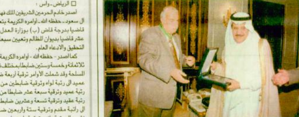
الأمير نسايف يقبل محي الدين وسام الملك عبدالعزيز من الدرجة الأولى □ الرياض - واس استقبل صاحب السمو الملكي الامير نسايف بن عبدالعزيز وزير الداخلية بمكتب سموه امس مدير الامن العام بالملكة الاردنية الهاشمية الفريق ركن نصحوح محي الدين والوفد الرافق له الذي يزور الملكة حاليًا.

تسلم رسالة من موسوي واستقبل شبكشي والسويلم الأمير نسايف يقبل محي الدين وسام الملك عبدالعزيز من الدرجة الأولى □ الرياض - واس استقبل صاحب السمو الملكي الامير نسايف بن عبدالعزيز وزير الداخلية بمكتب سموه امس مدير الامن العام بالملكة الاردنية الهاشمية الفريق ركن نصحوح محي الدين والوفد الرافق له الذي يزور الملكة حاليًا.