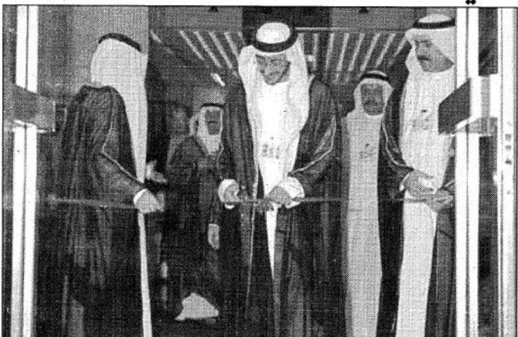
□ الشيخ عبدالله بن زايد افتتح المعرض الإعلامي لدول المجلس □

لجميع التمسك بالجلس والمجلس ونفاعة ال الامم ومزيد من التقدم. وتمنى سموه من قادة القمة وهي تعقد في ظل احتفالات دولة الامارات بعيدها السابع والعشرين ان تكون نظيرتهم الامور نظرة متباعدة وحديثة ومستقبلية ينسجمها التعاون والوفاق. وريا على سؤا حول التحديات السياسية والاقتصادية التي تواجه القمة بين ان التحديات السياسية كثيرة وان الجلس ينظر بشكل جيد ازدياد من التزام الاقتصادي لدول الخليج العربية معاهم اس على ان الجلس هو الشخ عبدالله بن زايد ان الموضوع ثمن اسعار النفط سيأخذ حيزا كبيرا من الاعية موضعا ان دول الجلس في اوبك تحافظ على حصص الانتاج المقررة لها وتمنى ان تأخذ دول الأخرى الدروس من دول الخليج في تعاملها وربطها بوعدها. وفي رد سموه على سؤال حول الموضوع الآتي المطروح على جدول أعمال القمة وعل سيكون هناك توجه واضح جديد والاصح علاقة مع ايران والعراق لشار سموه الى أهمية الموضوع الآتي خاصة في الظروف الاخيرة التي شهدتها المنطقة موضعا ان هناك نظرة شاملة ونظرة حقيقية حول العلاقة مع ايران والعراق.