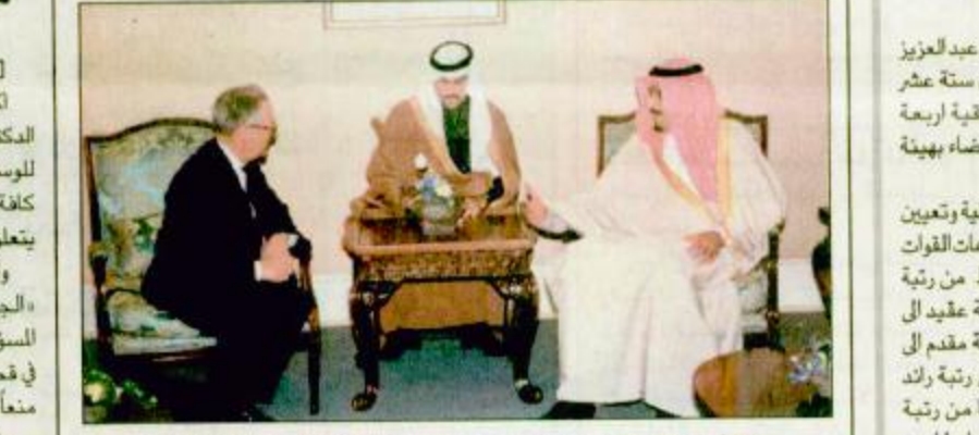
الأمير سلمان لدى استقباله ورئيس الجمعية الجغرافية الفرنسية □ الرياض - واس استقبل صاحب السمو الملكي الامير سلمان بن عبدالعزيز امع منطقة الرياض بمكتب سموه بصر الحكم امس الفريق نصحوح محي الدين مدير الامن العام للملكة الاردنية الهاشمية والوفد الرافق له.

ترأس الاجتماع الأول لمجلس أمناء مكتبة الملك فهد الوطنية الأمير سلمان استقبال مدير الأمن العام الأردني ورئيس الجمعية الجغرافية الفرنسية □ الرياض - واس استقبل صاحب السمو الملكي الامير سلمان بن عبدالعزيز امع منطقة الرياض بمكتب سموه بصر الحكم امس الفريق نصحوح محي الدين مدير الامن العام للملكة الاردنية الهاشمية والوفد الرافق له. □ الرياض - واس استقبل صاحب السمو الملكي الامير سلمان بن عبدالعزيز امع منطقة الرياض بمكتب سموه بصر الحكم امس الفريق نصحوح محي الدين مدير الامن العام للملكة الاردنية الهاشمية والوفد الرافق له.