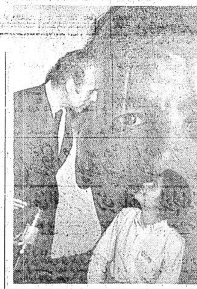
باريس - ٢٠ أبريل لاسلكية من ي.ب - الامة فاليرين امه الرئيس الفرنسي لرئاسة الجمهورية جيسكار ديستان تجلس يوم امس السبت في صورة كبيرة لوالدها وذلك في المسرح الرسمى لعملة جيسكار انتقافية .

القاهرة - وكالات ٢١ أبريل - ذكرت صحيفة الجمهورية القاهرية اليوم انه من المتوقع ان يزور الدكتور هنري كيسنجر وزير الخارجية الأمريكية القاهرة يوم الجمعة القادم لاجراء محادثات مع الرئيس أنور السادات والتشيد اسماعيل هني في القاهرة . وكانت الدلائل في السابق تشير الى توقع وصول كيسنجر الى القاهرة في احوال الشهر الحالي . ويتوقع ان يعكف كيسنجر خلال زيارته المكثفة للمنطقة على وضع اتفاق للفصل بين القوات السودانية والاسرائيلية في مرتفعات الجولان على غرار ذلك الذي حققه بين مصر واسرائيل في وجه قناة السويس في يناير الماضي .