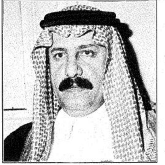
الأمير سلطان بن محمد / الأمير محمد بن سعود الكبير

كمادة فروسية الجزيرة في اجراء حواراتها المميزة.. مع كبار الملاك بالميدان السعودي سواء في بداية كل موسم أو مع نهايته أو في الأوقات المناسبة التي هي أحد أسرار وتتميز فروسية الجزيرة لقرانها.. وما نحن نواصل هذا النهج وتسير عليه.. من خلال هذا الحوار المثير والصريح مع صاحب السمو الأمير سلطان بن محمد بن سعود الكبير والذي وافق مشكوراً على هذا الحوار وبكل رحابة صدر تقبل سموه بعض أسئلتنا الصريحة جداً وتكون مع بداية موسمنا الفروسي الجديد الذي ينطلق عصر اليوم الأحد من مدينة الطائف.