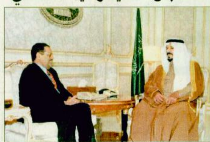
□ الأمير سلطان لدى استقباله السفير اليمني □ استقبل صاحب السمو الملكي الأمير سلطان بن عبدالعزيز النائب الثاني لرئيس مجلس الوزراء وزير الدفاع والطيران والمفتش العام في مكتب سموه بعد ظهر أمس سفير الجمهورية اليمنية لدى المملكة الدكتور محمد أحمد الكباب. وتم خلال الاستقبال مناقشة الموضوعات التي تهم البلدين الشقيقين. العقبية ص ٢٩

تلقى برفية شكر من د. طنطاوي سمو النائب الثاني استقبل السفير اليمني