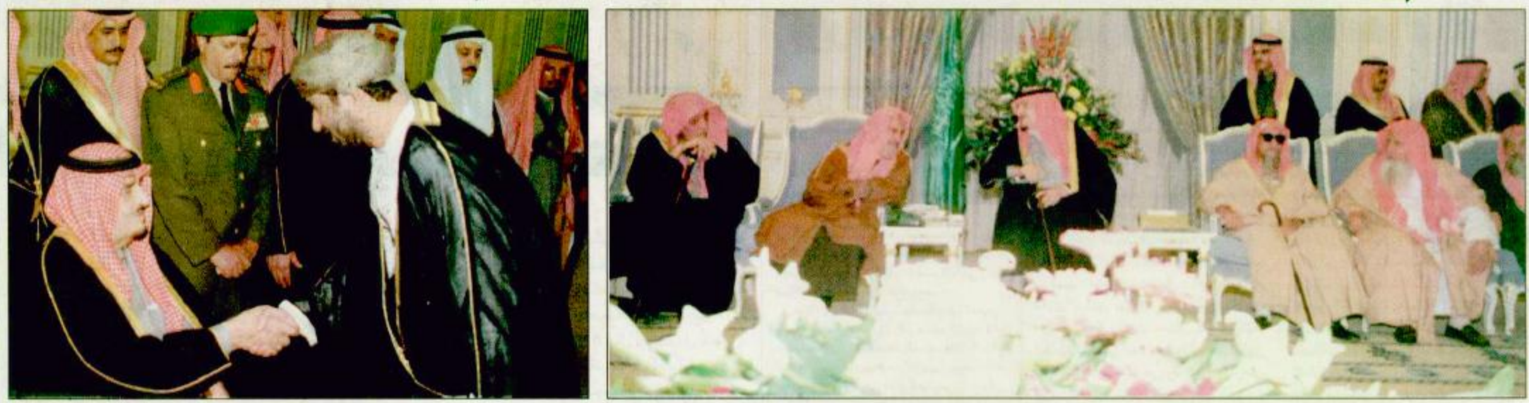
□ الرياض - واس □ استقبل خادم الحرمين الشريفين الملك فهد بن عبدالعزيز آل سعود في الديوان الملكي بقصر اليمامة مساء أمس أصحاب الفضيلة العلماء والشيخ. كما استقبل خادم الحرمين الشريفين الملك فهد بن عبدالعزيز آل سعود في الديوان الملكي بقصر اليمامة مساء أمس سفراء دول مجلس التعاون لدول الخليج العربية والدول العربية والإسلامية والصديقة بتقديمهم عميد السلك الدبلوماسي السفير عمر جوارا سفير جمهورية بوركينا فاسو الذين قدموا للسلام عليه أيده الله وتهنئته بشهر رمضان المبارك. العقبية ص ٢٩

هنا ملك نيبال وشكرو وزير الصحة خادم الحرمين استقبل العلماء وسفراء الدول الإسلامية والمواطنين