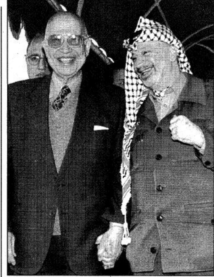
القاهرة (د.ب.أ.) الرئيس الفلسطيني ياسر عرفات (يمين) في وضع ضاحك مع أمين عام جامعة الدول العربية عصمت عبدالجديد بعد محادثتهما في القاهرة.

وقال نيتياهو وزير الدفاع الإسرائيلي في مقابلة مع شبكة «بي بي سي» أمس الأول في واشنطن «لا ينبغي إطلاق سراح الشيخ ياسين».