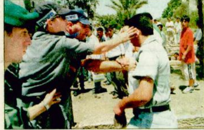
القدس - فلسطين (أ.ف.ب): شريطة إسرائيلية تصفح فلسطينياً خلال المفاوضات التي تمت في القدس المحتلة الأحوال لا يوجد شيء من شأنه يهدد حياة عرفات الذي اغتاله متطرف من اليمين الإسرائيلي عام 1995 في تل أبيب. وقد انضم الرئيس الأمريكي بيل كلينتون إلى قمة

كامب ديفيد - أ.ش.: أعلن وزيران إسرائيليان ان جيش إسرائيل الداخلي الإسرائيلي «شين بيت» يشتر أشاء أمن الأحد إلى وجود تهديدات من متطرفين يمينيين إسرائيليين بشأن اعتداءات على رئيس الوزراء إيهود باراك والرئيس الفلسطيني ياسر عرفات. وقال وزير الخارجية ديفيد ليفي للصحافيين ان رئيس شين بيت أشار فعلاً إلى اقوال في هذا الصدد مؤكدا ان جيشه ذكر في تقرير رفعه إلى الاجتماع الاسبوعي لمجلس الوزراء بالاعتداء على باراك وعرفات لدى عودتهما من كامب ديفيد. إلا ان ليفي الذي يقوم بأعمال رئيس الوزراء بالوكالة في غياب باراك، حاول التقليل من شأن هذه المخاطر قائلاً: ان الشين بيت منوب على أفضل وجه على متابعة هذه الأمور على كلب وعلى