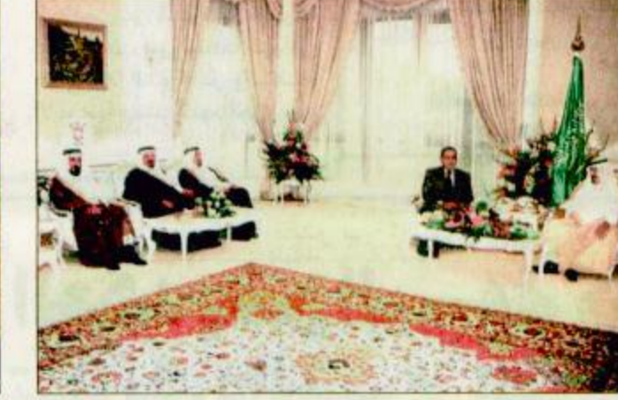
سمو ولي العهد يجتمع مع الرئيس المصري