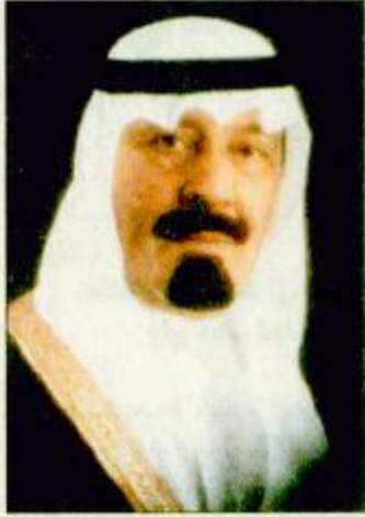
سمو ولي العهد السياحية التي تعد أحد متطلبات التنمية وتمثل رافداً من روافد الاقتصاد الوطني. وأضاف سموه في تصريح له ان مشروع تفريك الهدا هو واحد من

المشروعات الحضرية التي تجسد اهتمام الدولة بالسياحة الداخلية وتنميتها والوصول بها الى مراحل متقدمة بما يفي باحتياجات المواطنين وتحقيق رفاهيته وسعائه. وبين سموه ان السياحة الداخلية واقامة المشروعات التي تتدرج تحت هذا المفهوم تشكل اليوم ركيزة أساسية ومطلباً تنموياً ضرورياً مشيراً الى ان الدولة وفي إطار اهتمامها بالقطاع السياحي أنشأت الهيئة العليا للسياحة لدمج هذا الجانب والانطلاق به الى آفاق رحبة.