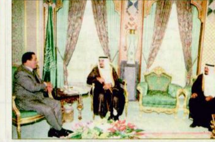
خادم الحرمين لدى استقباله الرئيس المصري

الملك فهد بن عبدالعزيز آل سعود في مكتبه بقصر السلام أمس سمو الشيخ جاسم بن حمد آل ثاني ولي عهد دولة قطر والوفد المرافق له. وقد نقل سمو الشيخ جاسم خادم الحرمين الشريفين تحيات وتقدير أخيه