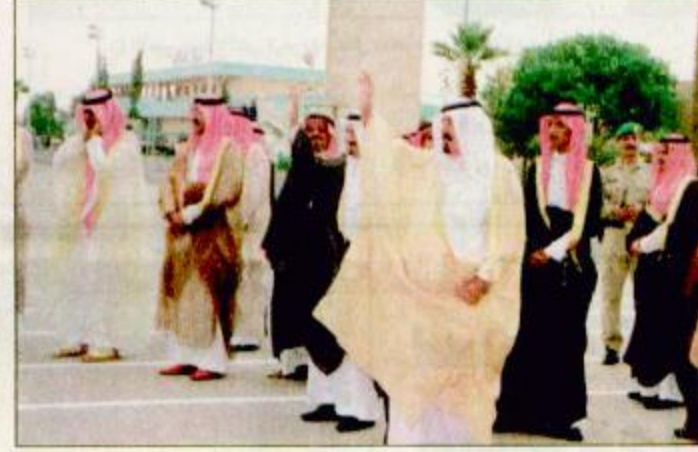
سمو ولي العهد يزور الرئيس المصري