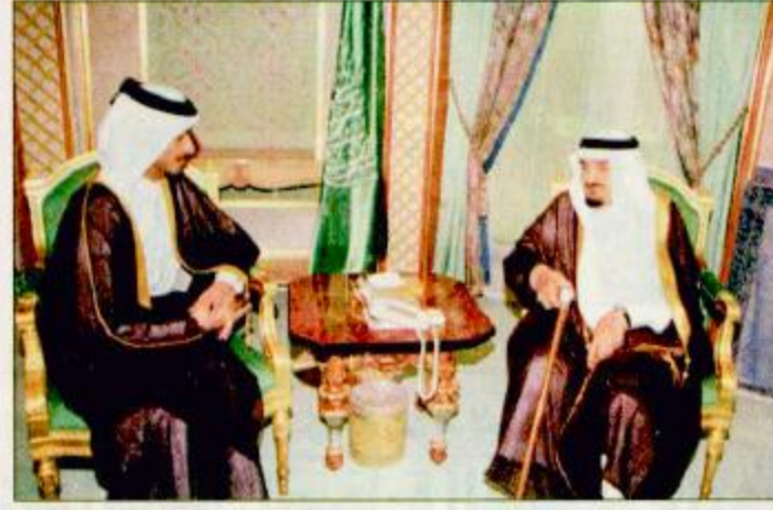
خادم الحرمين لدى استقباله الرئيس المصري