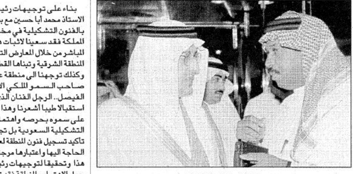
خالد فيصل يبحث للجزيرة... الفنية. الجدير ذكره ان القرية التشكيلية يوجد بها حوالي 9 مراسم مجهزة بكافة الوسائل للفنان التشكيلي ومؤمن بها المحرر:

تواصل مع خطه الطموحة نحو رعاية ودعم الحركة الفنية التشكيلية بالملكة العربية السعودية.. وحرصا منه اوضح صاحب السمو الملكي الامير خالد الفيصل امير منطقة عسير انه بصدد تكوين لجان خاصة تقوم بحصر كافة الفنون الشعبية بمنطقة عسير والتي ابرزها الرسوم الفطرية اللاهالي في قديم الزمن.. وأشار سموه في تصريح خاص للصفحة: انه سيتحدد قريبا اسماء الاشخاص المعنيين بهذا الرصد وسيتم تكليفهم بهذه المهمة.. وستقوم تلك اللجان بزيارة البيوت القديمة والهجرت والتعرف على فنون تلك المناطق وتسجيلها واعتبارها مرجعا فنيا خاصا..