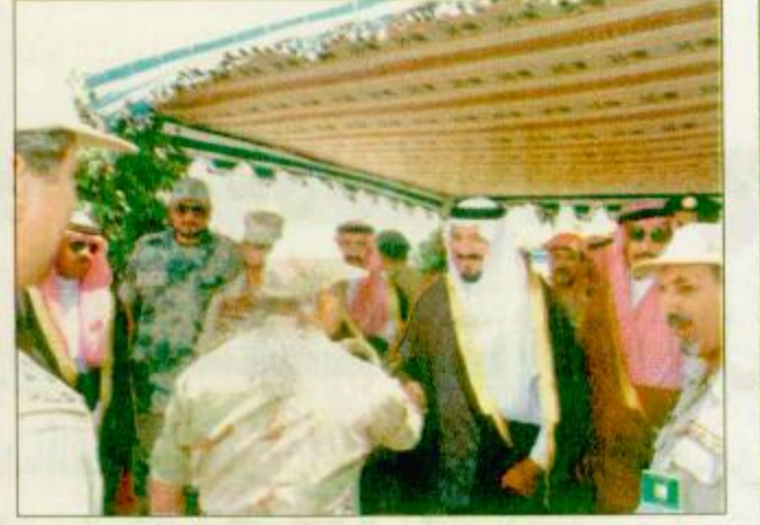
القطاعات من وصول سمو الأمير سلطان إلى منطقة نجران

سموه هنا قوة الواجب بالخرخير و عايد قوة نجران.. ويضع حجر الأساس لمركز الأمير سلطان للكلية اليوم :