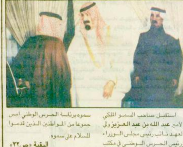
استقبل صاحب السمو الملكي الامير عبد الله بن عبدالعزيز ولي العهد نائب رئيس مجلس الوزراء ورئيس الحرس الوطني في مكتب سموه برتبة المشير الحرس الوطني امس جموعاً من المواطنين الذين قدموا للسلام على سموه.

القاهرة - الجزيرة - القدس المحتلة - سمر سعد الدين - الوكالات. تواصل الفلسطينيون والاسرائيليون الى نتائج جيدة جداً في مفاوضات بشأن انتخابات مجلس الحكم الذاتي الفلسطيني بحسب ما أعلن رئيس الوفد الاسرائيلي للمفاوضات مع الفلسطينيين يوفيل سنجر امس الاربعاء مع بدء جولة جديدة من المحادثات. واقطع دام حوالي شهر. واكد رئيس الوفد الفلسطيني صائب عريقات امس ان الاسرائيليين والفلسطينيين انتقلوا في جولاتهم الحالية من المفاوضات من مرحلة تبادل الافكار والمقترحات الى مرحلة الصياغة المشتركة لاتفاق خصوصاً في ما يتعلق بمفهوم مجلس الحكم الذاتي وتشكيله. وقال سنجر ان الوفدين سرفغان نتائج محادثاتهما الرئيس السلطة الوطنية الفلسطينية ياسر عرفات ورئيس الوزراء الاسرائيلي اسحق رابين قبل لقائهما المقرر اليوم الخميس في اريز المعبر الرئيسي بين الشرطة الفلسطينية تعتقل ٩٠ شخصاً في غزة واريحها اسرائيل ومنطقة الحكم الذاتي في قطاع غزة. من جانب اخر اعتقلت الشرطة الفلسطينية تحت ضغط من اسرائيل لوقف هجمات المقاتلين الفلسطينيين من ٩٠ فلسطينياً معارضاً وغلقت مكتبا صحفياً قبيل اجتماع قمة بين الزعيم الفلسطيني ياسر عرفات ورئيس الوزراء الاسرائيلي اسحق رابين اليوم الخميس. وقال مسؤولون ان ٧٢ شخصاً من المعتقلين الذين احتجزتهم الشرطة الفلسطينية خلال اليومين الماضيين في اريز المعبر الرئيسي بين استقبل صاحب السمو الملكي الامير عبد الله بن عبدالعزيز ولي العهد نائب رئيس مجلس الوزراء ورئيس الحرس الوطني في مكتب سمو برتبة المشير الحرس الوطني امس جموعاً من المواطنين الذين قدموا للسلام على سموه. البقية «ص ٢٢»