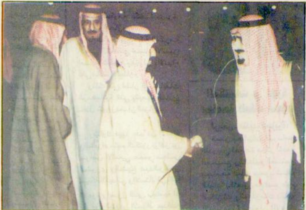
خادم الحرمين لدى وصوله الرياض مساء أمس □

أكد خادم الحرمين الشريفين الملك فهد بن عبدالعزيز آل سعود القائد الأعلى للقوات المسلحة، حفظه الله أن المملكة تسمى للملكة مع دول العالم متميزة ومتوازنة، وليس للمملكة ساء مع أحد.. جاء ذلك لبقائه «واس» لدى استقباله مدينة الملك خالد العسكرية بادة وضباط المنطقة الشمالية بقوة درع الجزيرة الذين قدموا للسلام عليه - حفظه الله - وأكد خادم الحرمين الشريفين في حديث أبوي شامل دور القوات المسلحة السعودية في الدفاع عن التمسك بالعبقيرة الإسلامية التي تفرح بها وأكد أن علاقات المملكة مع دول العالم متميزة ومتوازنة، وليس للمملكة ساء مع أحد.. جاء ذلك لبقائه «واس» لدى استقباله مدينة الملك خالد العسكرية بادة وضباط المنطقة الشمالية بقوة درع الجزيرة الذين قدموا للسلام عليه - حفظه الله - وأكد خادم الحرمين الشريفين في حديث أبوي شامل دور القوات المسلحة السعودية في الدفاع عن التفاهم جار بين المملكة واليمن للوصول الى النتائج المرجوة