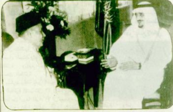
تسلم رسالة من الملك الحسن خادم الحرمين الشريفين بنقل عدة اتصالات هاتفية

تلقى خادم الحرمين الشريفين الملك فهد بن عبد العزيز آل سعود امس الجمعة اتصالات هاتفية من اشقائه ملوك ورؤساء الدول العربية. فقد تلقى حفظه الله طبقا له