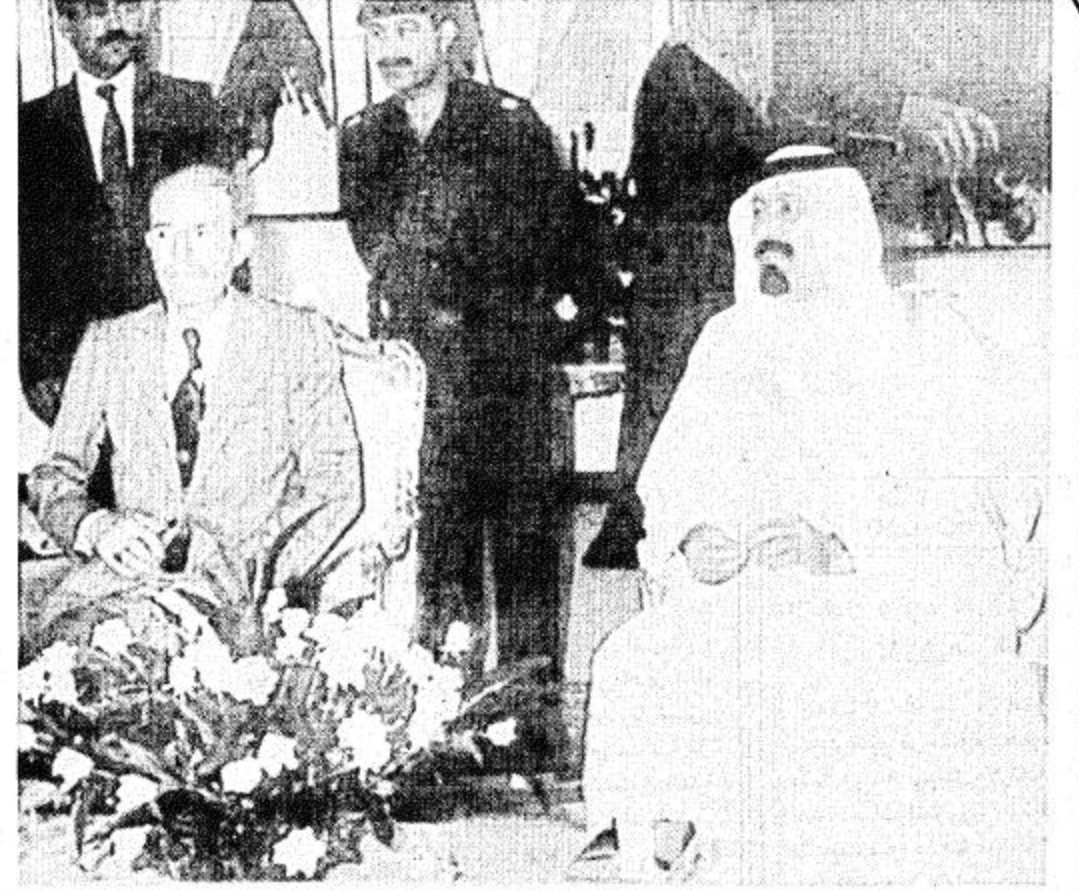
□ لقطات من استقبال صاحب السمو الملكي الأمير عبد الله بن عبدالعزيز وفي العهد ونائب رئيس مجلس الوزراء ورئيس الحرس الوطني، لدولة نائب رئيس مجلس قيادة الثورة العراقي عزت ابراهيم لدى وصوله الى مطار الملك عبد العزيز الدولي بجدة ظهر امس □