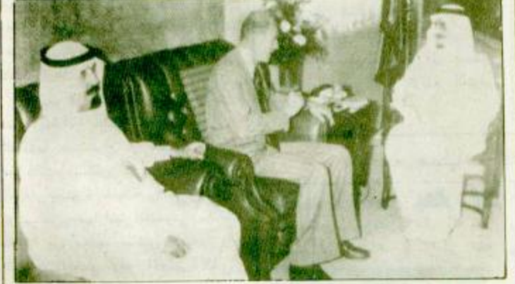
استقبل خادم الحرمين الشريفين الملك فهد بن عبد العزيز آل سعود بمرتبته في قصر السلام بمدينة جدة بعد

استقبله وودعه سمو ولي العهد فهد بن عبد العزيز آل سعود الملك فهد بن عبد العزيز آل سعود بمرتبته في قصر السلام بمدينة جدة بعد