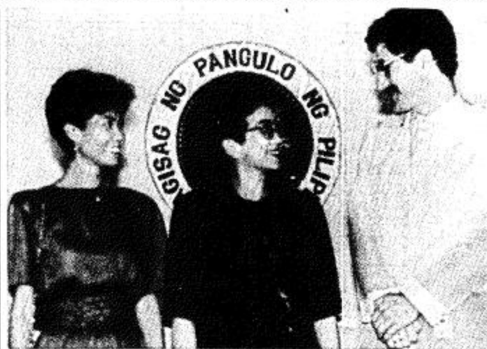
□ مينايا □ الرئيسة كورازون اكينو في حديث ودي مع متطوع رابطة السلام الأمريكية تيموثي سوانسون بينما زوجته ميرل تلتحق الموقوف اثناء دعوتها للمعرض الرئاسي.