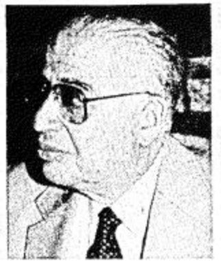
عبد المجيد يجتمع بالسفير العراقي بالقاهرة

● منات الكويتيين في عمان قاموا بمظاهرات أمس الأول امام السفارة وهم يحملون صور الشيخ جابر الاحمد وولي عهده، ويهتفون بالروح والدم نفديك يا جابر. ● حراس ومدربات اردنية تحرس السفارة الكويتية في عمان. ● القائم بالاعمال قال اننا على اتصال مع الحكومة الشرعية المقتة بالشيخ جابر الاحمد بالإضافة الى اتصالات من مصادر اخرى في الكويت. ● اكد القائم بالاعمال ان هناك ٧٠٠ (٧٠٠) قنيل كويتي، منهم ٧ شهداء من الاسرة الحاكمة لم تعرف هويتهم استشهدوا من جراء الغزو العراقي.