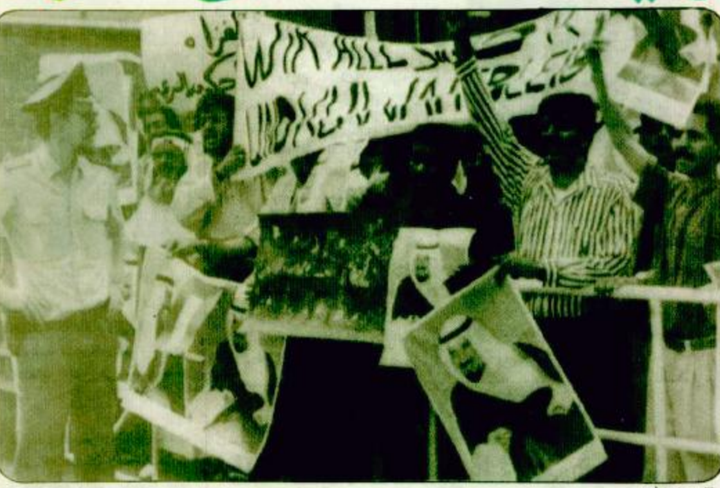
بون - اب. حوالي مائة شخص من الكويتيين يتظاهرون احتجاجا على غزو جيش العراق لكويت وذلك بالقرب من السفارة العراقية في بون.