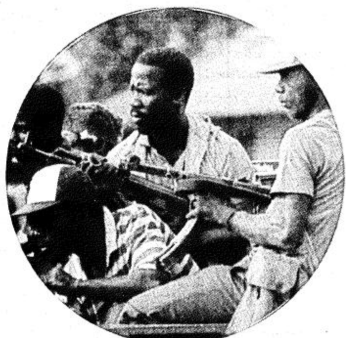
□ نيبيا - لبييريا - ا.ب. □ بعض النوازل الليبيريين على ظهر إحدى مركباتهم العسكرية قرب تايبتا بجوار أحد المواقع. القوات البحرية الأمريكية بعد عملياتها يوم الأحد الماضي لإجلاء الرعايا الأمريكيين من لبييريا □