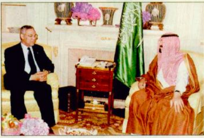
الأمير عبد الله أثناء اجتماعه مع باول

كما تم بحث العلاقات الثنائية بين البلدين الصديقين والوضع في منطقة الشرق الأوسط وفي مقدمته القضية الفلسطينية والأراضي العربية المحتلة إضافة إلى مجال الأوضاع الراهنة على الساحة الدولية. وحضر الاستقبال صاحب السمو الملكي الأمير نواف بن عبدالعزيز وصاحب السمو الملكي الأمير سعود الفيصل وزير الخارجية وصاحب السمو الملكي الأمير عبدالإله بن عبدالعزيز أمير منطقة الجوف وصاحب السمو الملكي الأمير بندر بن سلمان بن عبدالعزيز - البقية ص 37