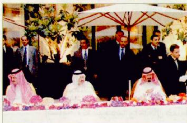
سمو ولي العهد يستقبل أصحاب السمو الملكي الأمراء وجمعاً من المواطنين السعوديين ويقيم حفل عشاء في باريس