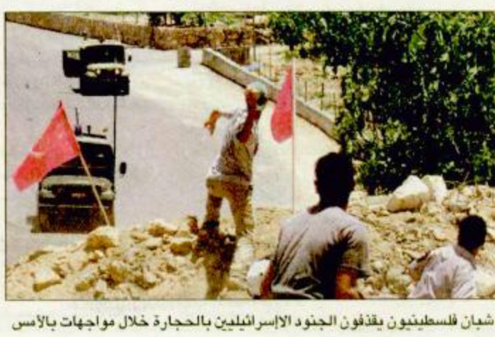
شبان فلسطينيون يقدون الجنود الاسرائيليين بالحجارة خلال مواجهات بالاس

حصل وزير الخارجية الأمريكي كوان باول الذي أنهى أمس الجمعة جولة في الشرق الأوسط على موافقة إسرائيل والفلسطينيين على وضع جدول زمني لاستئناف المفاوضات ولكن العد العكسي يتوقف على وقف العنف. وأسس الأول أعطى الرئيس الفلسطيني الذي شدد على ضرورة وقف الاستيطان الإسرائيلي ورفع الحصار - البقية ص 37