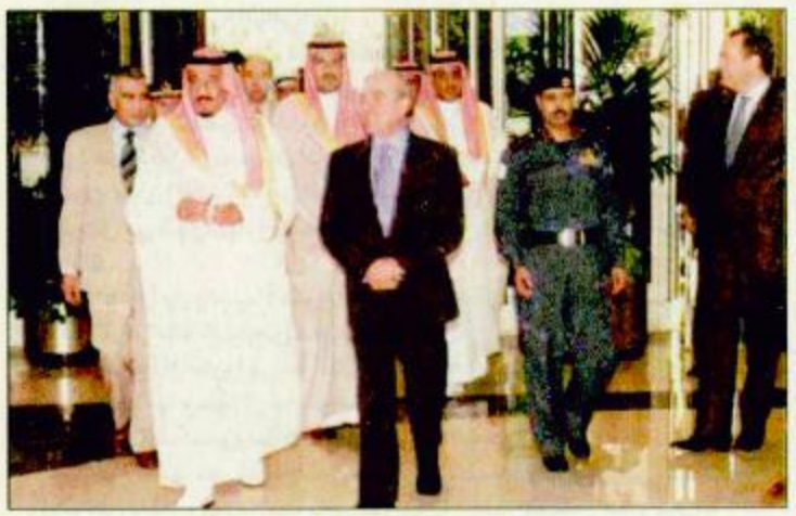
الأمير سلمان لدى مغادرته إسبانيا

قبرنانو دي المساء ورئيس التشرقيات بالخارجية الإسبانية بارانديتا. وأكد سموه في تصريح صحفي «ان زيارتي للبرتغال وإسبانيا مفررة منذ وقت طويل وليس من الان ولاشك ان التحرك الذي يقوم به سمو ولي العهد له أبعاد أكبر من زيارتي شخصيا للبلدين والتحرك الذي تقوم به المملكة بكل مسؤوليتها بتوجيه خاص من خادم الحرمين الشريفين في كل الدول وكل المجالات لا شك ان فيه دعماً كبيراً للقضية العربية بصفة عامة» - طالع ص 37