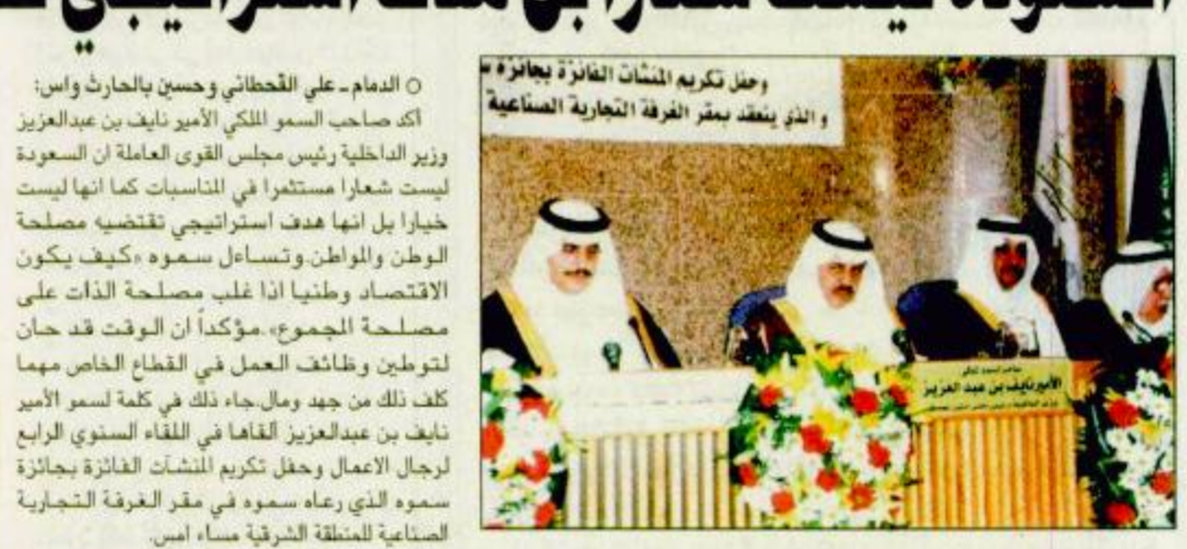
○ الأمير نايف لدى رعايته اللقاء الرابع لرجال الأعمال

○ جدة-واس: اتخذ صاحب السمو الملكي الأمير نايف بن عبدالعزيز وزير الداخلية رئيس مجلس القوى العاملة ان السعودة ليست شعاراً مستتراً في المناسبات كما انها ليست خياراً بل انها هدف استراتيجي تقتضيه مصلحة الوطن والمواطن وتساهل سموه «كيف يكون الاقتصاد وطنياً اذا غلب مصلحة ذات على مصلحة المجموع». مؤكداً ان الوقت قد حان لتوطين وظائف العمل في القطاع الخاص مهما كلف ذلك من جهد ومال جاء ذلك في كلمة لسمو الأمير نايف بن عبدالعزيز القاها في اللقاء السنوي الرابع لرجال الأعمال وحفل تكريم المنشآت الفائزة بجائزة سموه الذي رعاها سموه في مقر العرفة التجارية لصناعة للمنطقة الشرقية مساء أمس.