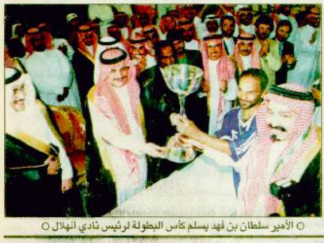
○ الأمير سلطان بن فهد يسلم كأس البطولة لرئيس نادي الهلال

○ كتب - عبدالكريم الجاسر: حقق فريق الهلال السعودي كأس بطولة الأندية الآسيوية التاسعة عشرة لأبطال الدوري للمرة الثانية في تاريخه بعد فوزه على فريق جابوليو الياباني حامل اللقب بالهدف الذهبي الذي سجله اللاعب سيرجيو في الدقيقة (١٢) من الشوط الإضافي الأول بعد ان انتهى الشوط الأصليان للمباراة التي جمعتهما على استاد الملك فهد الدولي بالرياض مساء أمس بتعادلهما بهدفين لثمة وسلم صاحب السمو الملكي الأمير سلطان بن فهد بن عبدالعزيز الرئيس العام لرعاية الشباب الذي رعى المباراة الختامية لكأس الآسيوية والبيات الذهبية لنجوم الهلال صفحات تغطية عن البطولة بالداخل