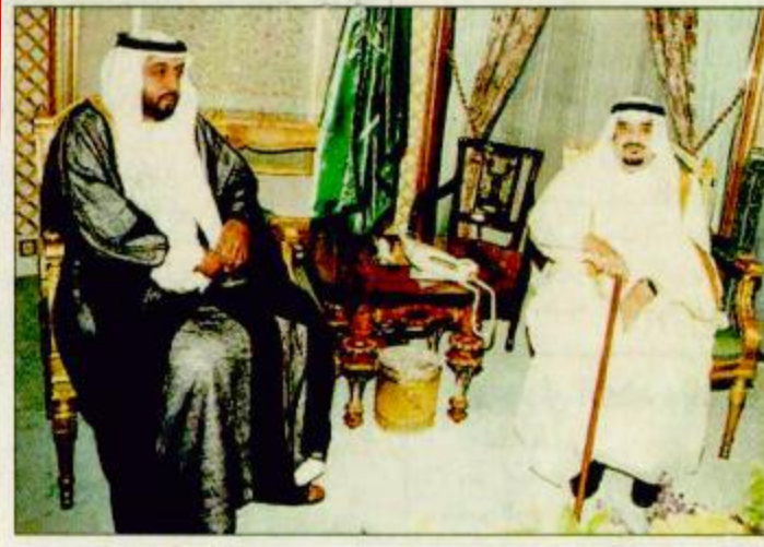
○ خادم الحرمين الشريفين يقبل ولي عهد أبو ظبي وشاح الملك عبد العزيز

○ جدة-واس: استقبل خادم الحرمين الشريفين الملك فهد بن عبدالعزيز آل سعود - حفظه الله - في مكتبه بقصر السلام أمس صاحب السمو الشيخ خليفة بن زايد آل نهيان ولي عهد أبوظبي نائب القائد الأعلى للقوات المسلحة بدولة الإمارات العربية المتحدة والوفد المرافق له الذي نقل لخادم الحرمين الشريفين تحيات وتقدير أخيه صاحب السمو الشيخ زايد بن سلطان آل نهيان رئيس دولة الإمارات العربية المتحدة الشقيقة. وقد قلّد خادم الحرمين الشريفين صاحب السمو الشيخ خليفة بن زايد آل نهيان ولي عهد أبو ظبي نائب القائد الأعلى للقوات المسلحة وسمو الفريق الركن طيار الشيخ محمد بن زايد آل نهيان رئيس أركان القوات المسلحة وسمو الشيخ أحمد بن زايد