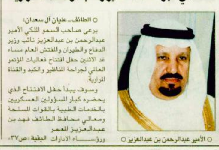
○ الأمير عبدالرحمن بن عبدالعزيز

○ الطائف-عليان آل سعيان: يري صاحب السمو الملكي الأمير عبدالرحمن بن عبدالعزيز نائب وزير الدفاع والطيران والمفتش العام مساء غد الاثنين حفل افتتاح فعاليات المؤتمر العالمي لجراحة المناظير والكبد والقناة المرارية. وسوف يبدأ حفل الافتتاح الذي يحضره كبار المسؤولين العسكريين بالخدمات الطبية بالقوات المسلحة ومعالي محافظ الطائف فهد بن عبدالعزيز المعمر رؤساء الإدارات الطبية ص ٣٧.