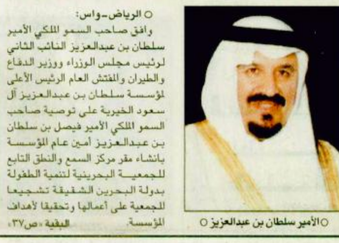
○ الأمير سلطان بن عبدالعزيز

○ الرياض-واس: وافق صاحب السمو الملكي الأمير سلطان بن عبدالعزيز النائب الثاني لرئيس مجلس الوزراء ووزير الدفاع والطيران والمفتش العام ورئيس الأعلى مؤسسة سلطان بن عبدالعزيز آل سعود الخيرية على توصية صاحب السمو الملكي الأمير فيصل بن سلطان بن عبدالعزيز أمين عام المؤسسة بإنشاء مقر مركز السمع والنطق التابع للجمعية البحرينية لتنمية الطفولة بدولة البحرين الشقيقة تشجيعاً للجمعية على أعمالها وتحقيقاً لأهداف المؤسسة. البيقية ص ٣٧.