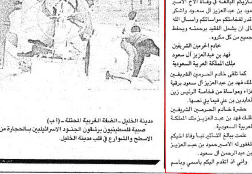
مدينة الخليل - الضفة الغربية المحتلة - (ب) صبية فلسطينيون يرتفون الجسود الاسرائيليين بالبحارة من فوق الاسطح والشوارع في قلب مدينة الخليل