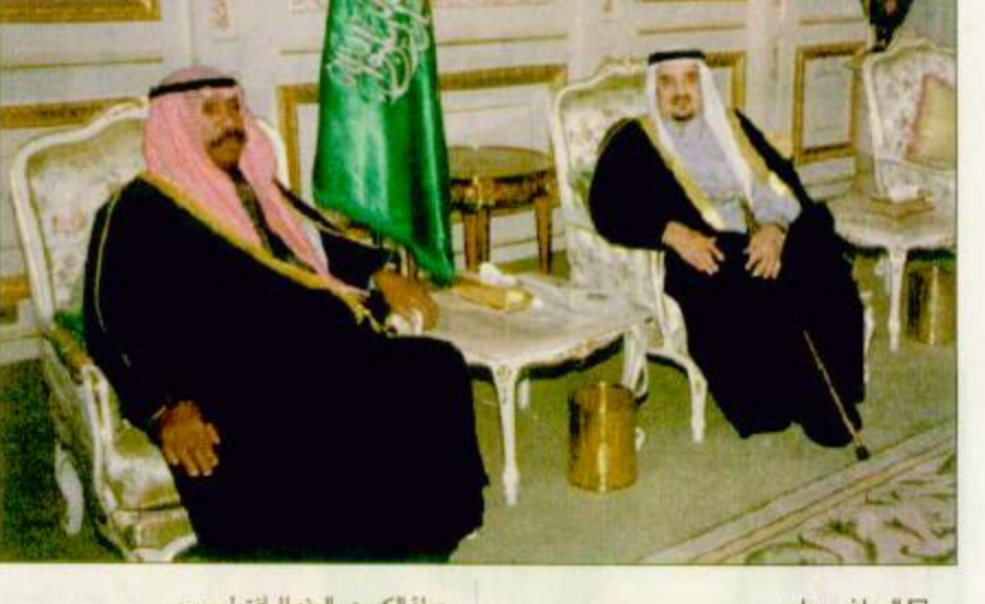
بذولة الكويت والوفد الرفيق لسموه. وقد نقل سمو الشيخ سعد العبدالله لخدام الحرمين الشريفين تحيات وتقدير اخيه صاحب السمو الشيخ جابر الاحمد الصباح امير دولة الكويت

الرياض - واس استقبل خادم الحرمين الشريفين الملك فهد بن عبدالعزيز آل سعود في قصر اليمامة امس صاحب السمو الشيخ سعد العبدالله السالم الصباح ولي العهد ورئيس مجلس الوزراء