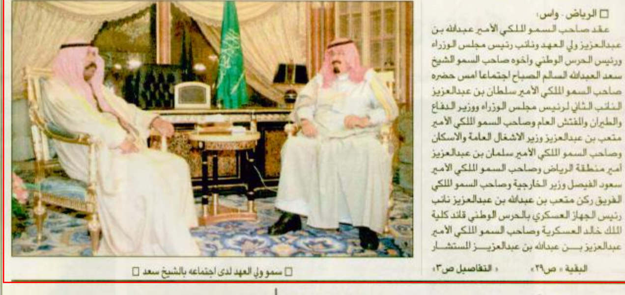
سمو ولي العهد لدى اضماعه بالشيخ سعد

الرياض - واس عقد صاحب السمو الملكي الامير عبدالله بن عبدالعزيز ولي العهد ونائب رئيس مجلس الوزراء ورئيس الحرس الوطني واخوه صاحب السمو الشيخ سعد العبدالله السالم الصباح اجتماعا أمس حضره صاحب السمو الملكي الامير سلطان بن عبدالعزيز النائب الثاني لرئيس مجلس الوزراء ووزير الدفاع والطيران والمفتش العام وصاحب السمو الملكي الامير متعب بن عبدالعزيز وزير الاشغال العامة والاسكان وصاحب السمو الملكي الامير سلمان بن عبدالعزيز امير منطقة الرياض وصاحب السمو الملكي الامير سعود الفيصل وزير الخارجية وصاحب السمو الملكي الفخريو ركن متعب بن عبدالله بن عبدالعزيز نائب رئيس الجهاز العسكري بالحرس الوطني قائد كلية الملك خالد العسكرية وصاحب السمو الملكي الامير عبدالعزيز بن عبدالله بن عبدالعزيز المستشار