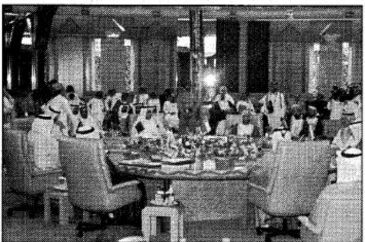
جانب من الجلسة الختامية لاجتماع وزراء الداخلية بدول مجلس التعاون الخليجي