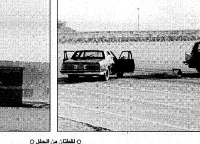
لقطبان من الحفل