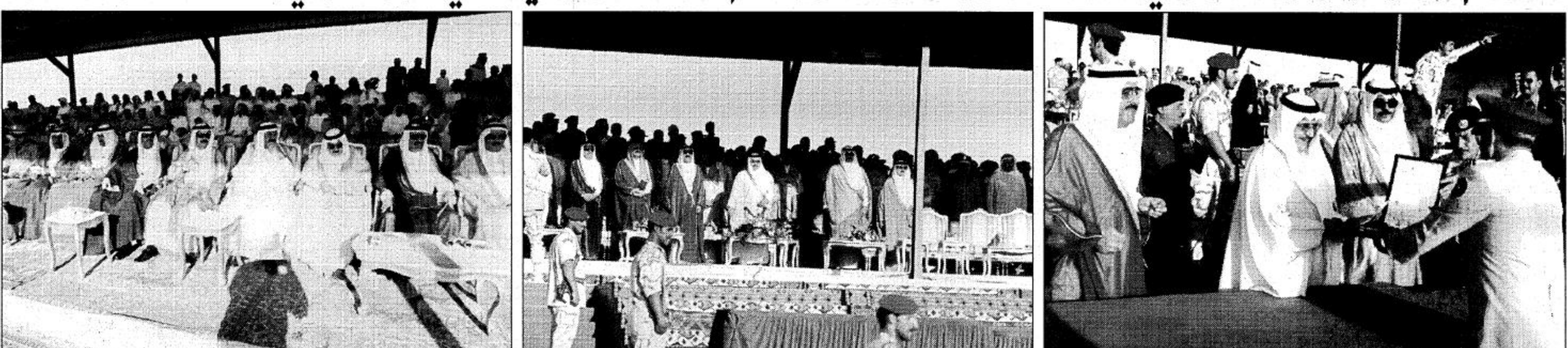
الأمير نايف والحضور يتابعون فقرات الحفل