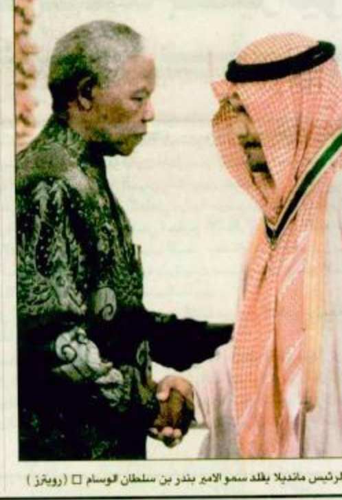
□ الرئيس مانديلا يقبل سمو الأمير بندر بن سلطان الوسام

وكانت الملكة العربية السعودية وجمهورية أفريقيا قد بذلتا جهوداً مشتركة لحل القضية بالنظر في الفاني بتسليم المشتبه بهما بعد أخذ الضمانات من الأطراف الأخرى المعنية بالقضية بأن يحاكمهما محكمة عادلة ورفع العقوبات عن ليبيا فور وصول المشتبه بهما إلى لاهاي لمحاكمتهم. ويمثل تكريم سمو الأمير بندر بن سلطان على هذا المستوى نجاحاً للديبلوماسية السعودية في إنهاء الخلافات بين طرفين متنازعين وحرصاً من الملكة ببناتها الرشيدة لنها المعاناة عن الشعوب العربية وتوفير كل مصادر السعادة والحياة الآمنة لها. (طابع ص ٣)