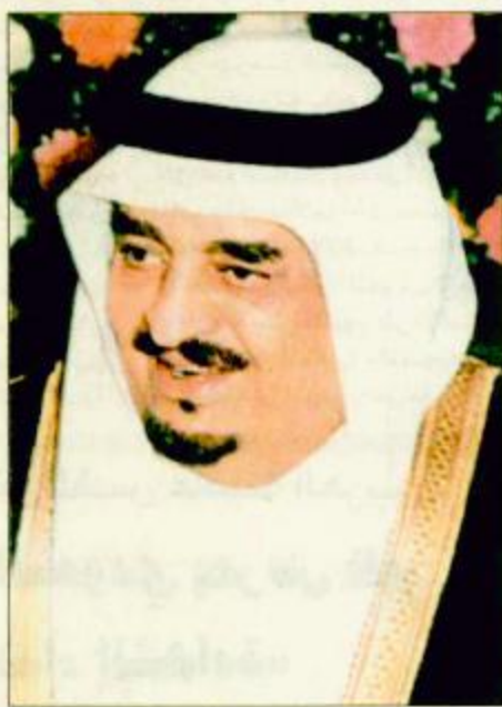
خادم الحرمين الشريفين

وجه خادم الحرمين الشريفين الملك فهد بن عبدالعزيز آل سعود شكره لعالي وزير الصحة رئيس الدورة الثامنة والأربعين لاجتماعات منظمة الصحة العالمية لاقليم شرق المتوسط الدكتور أسامة شيكشي على ما عبر عنه وكافة رؤساء وأعضاء الوفود المشاركة في الاجتماعات التي عقدت بالرياض من مشاعر ودعوات طيبة. وكان حفظه الله - في برقية جوابية أن ما قبول به رؤساء وأعضاء الوفود المشاركة في اجتماعات منظمة الصحة العالمية لاقليم شرق المتوسط بمدينة الرياض هو ما يقتضيه واجب الضيافة. ودعا الله تعالى أن يوفق ويأخذ بأيدي الجميع لما فيه خير الأمة الإسلامية وعزها وأعلام شأن الإسلام والمسلمين. وكان معالي وزير الصحة قد رفع برقية لخادم الحرمين الشريفين عبر فيها باسم رؤساء وأعضاء الوفود المشاركة في تلك الاجتماعات عن أسامي آيات الشكر والتقدير والعرفان على ما وفرت حكومة المملكة من كرم الضيافة وحفاوة الاستقبال. وأشار معاليه إلى أن رؤساء وأعضاء الوفود يعبرون عن اعجابهم بالضيافة الشاملة والمسيرة المباركة التي تشهدها المملكة في العهد الزاهر لخادم الحرمين الشريفين