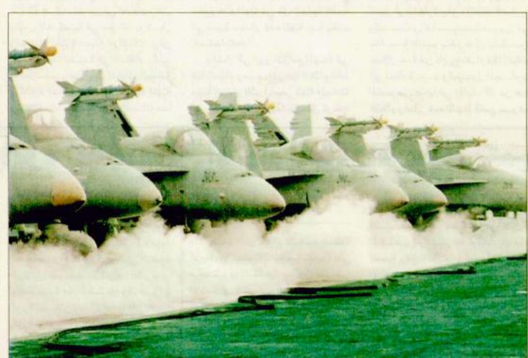
طائرات أمريكية تنفذ الهجوم المحفعل على أفغانستان

واشنطن - كابول - الوكالات - الإنترنت: استكملت الولايات المتحدة الأمريكية بناء قوة عسكرية كبيرة في جنوب غرب آسيا قوامها أربع حاملات طائرات ومجموعة برمائية 350 طائرة حربية و30 ألف جندي من القوات الخاصة. وهذه القوة مهاجمة مواقع قوات حركة طالبان ومعسكرات تنظيم القاعدة للقبض على أسامة بن لادن. ويتألف هذا الحشد من حاملات الطائرات انتربرايز وكيتي هوك وكارول فنسون، وتينودور روزفلت، ومجموعات أسراب الطائرات التي ستتطلق إما من القواعد الأرضية أو من حاملات الطائرات، وتضم هذه الأسراب طائرات مقاتلة وقاذفة، ومروحيات وطائرات المراقبة، والقوات الخاصة من دلتا فورس، آرمي رينجرز، «الصاعقة»، والقوات البريطانية الخاصة «ساس» وقوات البحرية الأمريكية الخاصة «سيل تيم 6» والكتائب الخضراء، والعملة 160. وتتكون المجموعة القتالية لحاملة الطائرات انتربرايز الموجودة ببحر العرب من غواصتين: «جياكسوف فيلبي»، و«بروفيدنس»، و«طرازين»، «فيلبين سي»، «جيتسبيرج»، و«خمس دمدرات: «ماكول»، «جوزالز»، «ستوت»، «ثورن»، «نيكلسون»، و«فرقاطة «نيكولاس» وقطعة بحرية قتالية معاونة «آركيت». أما حاملة الطائرات تينودور روزفلت فتتكون مجموعتها القتالية من غواصتين «جياكسوف فيلبي»، و«بروفيدنس»، و«طرازين»، «فيلبين سي»، و«أربع دمدرات: «راميدج»، «روس»، «بيترسون»، و«هايلر»، و«فرقاطة إيلورده» وثلاث سفن برمائية هجومية: «باتان»، «شريفبورن»، و«إيدبي إيلاند»، وقطعة بحرية قتالية معاونة «بيترويت»، ومن المعروف أن حملة الطائرات روزفلت تتمركز قبالة سواحل قبرص في البحر المتوسط. وفي الخليج العربي ترافق حاملة الطائرات كارل فنسون