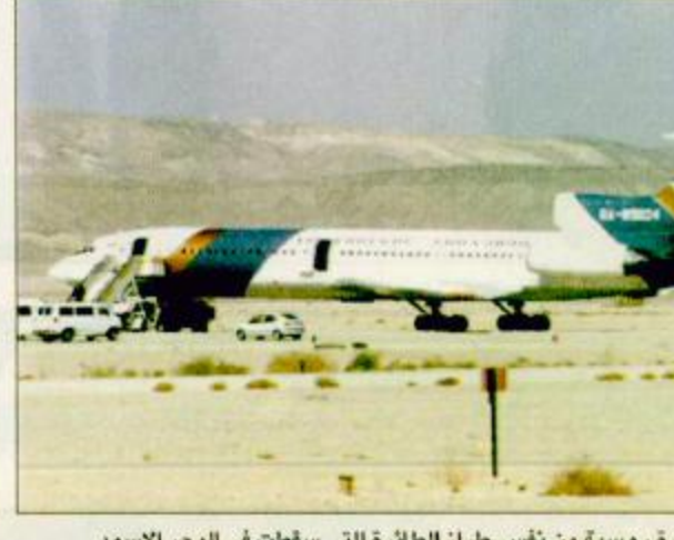
طائرة روسية من نفس طراز الطائرة التي سقطت في البحر الأسود