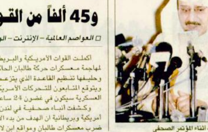
الأمير نايف أثناء المؤتمر الصحفي