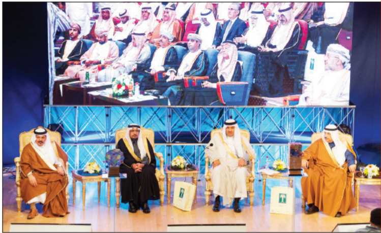
الأميران سلطان بن سلمان و فيصل بن مشعل

لقد اعتادت الجائزة منذ أن أطلقها صاحب السمو الملكي الأمير سلطان بن سلمان بن عبدالعزيز على أن تحتفي بالفائزين في ربوع مملكتنا الحبيبة، واليوم نحن في منطقة القصيم المنحطة التي تمتز بتراثها العمراني الوطني الأصلي، وعلى مدار الأعوام العشرة