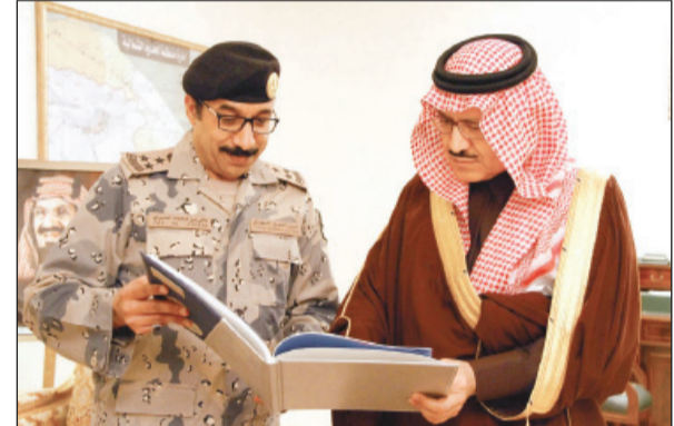
الأمير مشعل بن عبدالله مستقبلاً العميد على عسيري

على بلاندا أمنها ورخاءها وأن يرد كيد الحاقدين إلى نحورهم. جاء ذلك خلال لقاء سموه أمس، قائد حرس الحدود بالمنطقة العميد