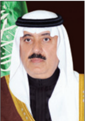
الأمير متعب بن عبدالله

من جانبه أكد الدكتور أحمد بن سليمان العسكر المدير التنفيذي لمركز الملك عبدالله العالمي للأبحاث الطبية، أهمية البحث ودوره الكبير في المجال الصحي، مبينا أن فعاليات المنتدى ستتضمن عددا من الموضوعات القيمة التي ستسهم في تعزيز دور التنمية الصحية الشاملة، كما سيتطرق لورش عمل تتضمن مواضيع عدة مثل: التوجه نحو الدقة في علاج السكري والسرطان، وتسجيل براءات الاختراع والابتكارات والملكية الفكرية في الشؤون الصحية بوزارة الحرس الوطني وتعزيز أخلاقيات البحوث العلمية وشهادة البحوث الإكلينيكية للمهنيين.