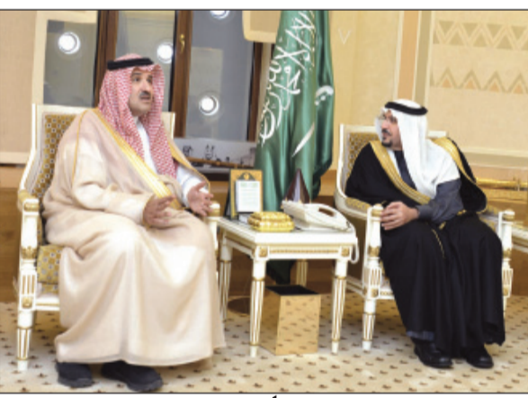
أمير القصيم مستقبلاً الأمير فيصل بن سلمان

من اهتمام سمو أمير القصيم في بذل الجهود لإنجاح ملتقى التراث العمراني الخامس.