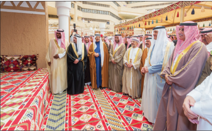
رئيس الهيئة وأمير القصيم يتجولان في المعرض للمصاحب

كانت جائزة الأمير سلطان بن سلمان للتراث العمراني تقف آثار المبدعين بينما كانوا مهنيين كانوا أم طلابا، كما استطاعت بناء علاقات وطيدة بينها وبين الجامعات التي كانت تحتضن حفل الجائزة وتحفها بها، وكذلك الهيئات الحكومية وأمانات المناطق في المملكة وفي مجلس التعاون لدول الخليج العربية، مشيرا إلى أن الجائزة عند إطلاقها قبل عشرة أعوام حققت عددا من النجاحات حيث أصبحت فروع الجائزة ٨ فروع، وتقدم لها منذ تأسيسها ٣٥٢ مشروعا، وقام ٧٥ طالبا وطالبة من جامعات المملكة ودول الخليج.