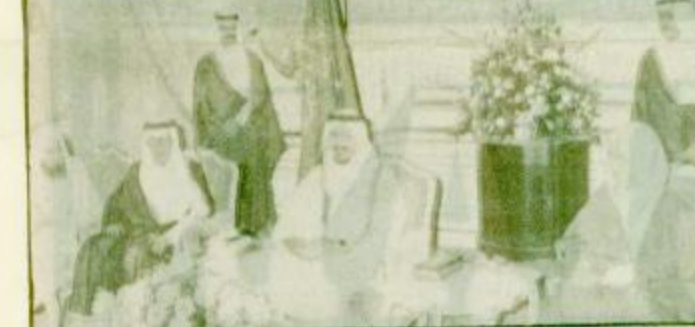
استقبل صاحب السمو الملكي الأمير سلطان بن عبدالعزيز النائب الثاني لرئيس مجلس الوزراء ووزير الدفاع