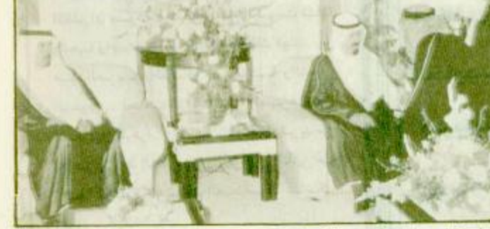
استقبل صاحب السمو الملكي الأمير عبد الله بن عبدالعزيز ولي العهد ونائب رئيس مجلس الوزراء ورئيس المجلس الأعلى للدراسات الإسلامية