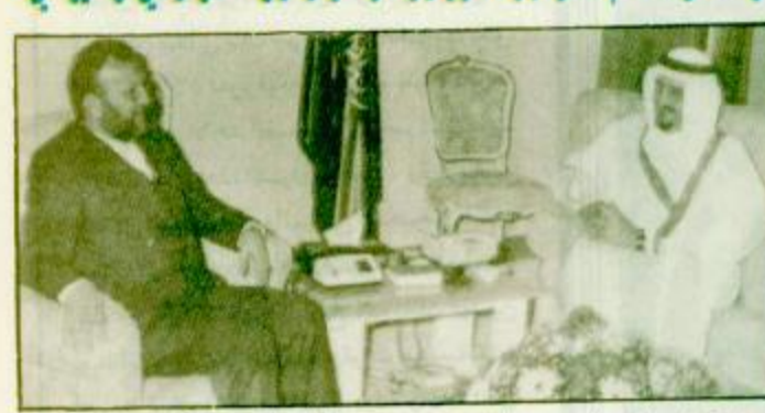
استقبل خادم الحرمين الشريفين - حفظه الله - في مكتبه بقصر السلام الملك فهد بن عبدالعزيز آل سعود