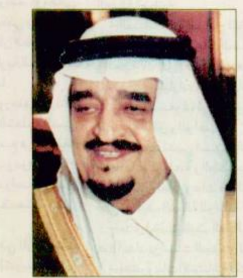
مطمئنة ولله الحمد وأكد الفريق الطبي الذي استدعي من الولايات المتحدة الأمريكية وأجرى مزيداً من الفحوصات

الطبية الشاملة يومي الجمعة والسبت التاسع والعاشر من شهر رجب ١٤١٦ هـ الموافق الأول والثاني من شهر ديسمبر ١٩٩٥ م ان الحالة الصحية لخادم الحرمين الشريفين مطمئنة ولا تدعو للقلق. كما أكد الفريق الطبي ان العارض الصحي الطارىء الذي ألم به - حفظه الله - كان بسبب ضغوط العمل والأرهاق الناتج عنها. هذا وقد اوصى الأطباء بأن يقضي خادم الحرمين الشريفين وقتاً كافياً للراحة والاستجمام. نسأل الله ان يحفظ خادم الحرمين الشريفين ويضفي عليه نعمة الصحة والعافية ويسبغ عليه نعمه ظاهرة وباطنة وان يمدد سبحانه وتعالى بالمزيد من العون والتوفيق.