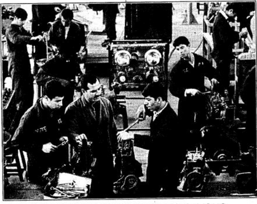
○ المملكة تساهم في تشغيل وغوث اللاجئين الفلسطينيين التي تشرف عليها الأونروا ○

مشروع اجتماعية أخرى من بينها على سبيل المثال لا الحصر رفع مستوى الخدمات في جميع مراكز التأهيل الاجتماعي للمرأة وأنشاء عشرة مراكز اجتماعية جديدة للمرأة الفلسطينية.