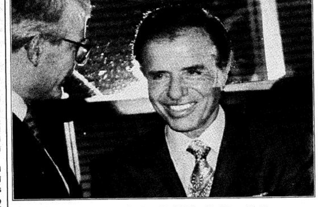
○ جون ميغور يلتقي بالرئيس الاردني ياسر عرفات في نيويورك ○