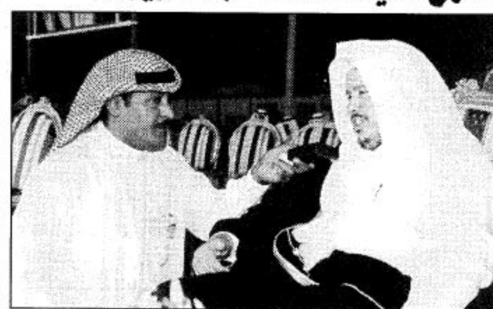
□ وزير العدل بنحمد لـ الجزيرة، □

وصف معالي الدكتور عبدالله آل الشيخ وزير العدل زيارة نائب خادم الحرمين الشريفين لحفاظة الطائف بأنها تندرج في إطار اهتمام رسمي حكومة خادم الحرمين الشريفين وسمو نائب خادم الحرمين الشريفين وسمو النائب الثاني للإطلاع على مناطق المملكة بصورة عامة عن كسب وتطويرها وتوفير كافة الخدمات اللازمة للمواطنين في تلك المناطق.