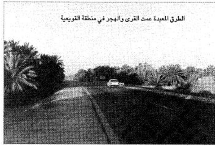
الطرق المعبدة تمت القرى والهجر في منطقة القويعة

الدائم والمتواصل لجهود البلدية التي تعمل دائماً على راحتهم وإسعادهم.