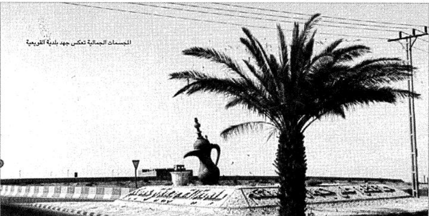
المساحات الجمالية تنكس جهود بلدية القويعية

بسم الله والصلاة والسلام على أشرف الأنبياء والمرسلين نبينا محمد وعلى آله وأصحابه أجمعين: أما بعد: في بداية هذا الحديث نرحب بمعالي وزير صحة في محافظة القويعية ونشكره على هذه لزيارات التفقدية المتوالية للإطلاع عن كثب على مرافق الوزارة وسير أعمالها ولسد احتياجاتها كما نشكر حكومتنا الرشيدة حيث تسعى لكل ما يصلح الوطن والمواطن ويلبي حاجات المجتمع بمحافظتنا القويعية تشهد هذه الأيام تطوراً واسعاً في جميع المجالات والله الصمد فقد انتعشت المشاريع انتعاشاً ملموساً في هذه السنة على