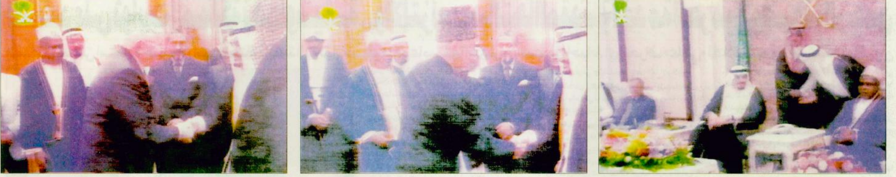
وزير الحج ينقل لخادم الحرمين الشريفين شكر وامتنان رؤساء بعثات الحج الإسلامية: