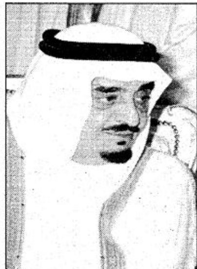
الملك فهد بن عبدالعزيز بن عبدالمطلب آل سعود

مع تطور المملكة العربية السعودية وبناء قوتها الدفاعية الذاتية كان الحرس الوطني ولازال وسيظل بحول الله تلك المؤسسة الحضارية العسكرية التي تعمل على تعميق قيم الأمن والرخاء والاستقرار بتوفير من العلي القدير ثم بجهود ومتابعة صاحب السمو الملكي الامير عبد الله بن عبدالعزيز ولي العهد ونائب رئيس مجلس الوزراء الذي تولي مسئولية الاشراف والاعداد ووضع الخطط التنفيذية للحرس الوطني منذ تعيينه رئيسا للحرس الوطني قبل ستة وثلاثين عاما 1382/9/11هـ الذي ما انفك يسعى الى تأمين كل احتياجات افراده متأسيا في ذلك بتجهيز القواعد الاعلى للقوات المسلحة في عملية بناء الانسان السعودي. حيث شهد الحرس الوطني العديد من الانجازات الحضارية بما فيها مشروعات اسكان الحرس الوطني الذي اصبح يوظف كل مراحل تطور وتقدم الحرس الوطني ليلتقي مع نهج الاعداد والتكوين للقوة البشرية والقوة الالية التي تضاعفت لتشكل انسان الحرس الوطني الواعي والذكي المثقف.