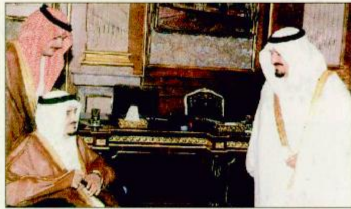
○ خادم الحرمين لدى ترؤسه جلسة مجلس الوزراء ○

○ جدة-واس: رأس خادم الحرمين الشريفين الملك فهد بن عبدالعزيز آل سعود - حفظه الله - الجلسة التي عقدها مجلس الوزراء بعد ظهر أمس الاثنين في قصر السلام بمحافظة جدة. واستعرض المجلس المستجدات في المنطقة خاصة تعثر المفاوضات الفلسطينية الإسرائيلية بسبب التعنت الإسرائيلي في تنفيذ الاتفاقات الوعده بين الجانبين. وجدد المجلس وقوف المملكة ودعمها للشعب الفلسطيني للحصول على كافة حقوقه المشروعة بما فيها حقها في إقامة دولته المستقلة وعاصمتها القدس وعودة اللاجئين إلى ديارهم وحقوقهم في التعويضات.