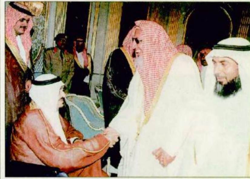
○ خادم الحرمين لدى استقباله مفتي عام المملكة ووزير العدل ورؤساء المحاكم الشرعية ○

○ جدة-واس: استقبل خادم الحرمين الشريفين الملك فهد بن عبدالعزيز آل سعود في قصر السلام أمس سماحة الشيخ عبدالعزيز بن عبدالله آل الشيخ مفتي عام المملكة ورئيس هيئة كبار العلماء وإدارة البحوث العلمية والإفتاء ومعالي وزير العدل الدكتور عبدالله بن محمد آل الشيخ وأصحاب الفضيلة العلماء رؤساء المحاكم الشرعية بالمملكة. وقد رحب خادم الحرمين الشريفين خلال المقابلة بأصحاب السماحة والفضيلة المشايخ والقضاة متمنيا لهم التوفيق والسداد وأن تكمل أعمال ندوتهم الثالثة بالنجاح والتوفيق. وقال حفظه الله إن هذه البلاد منذ أن تأسست قامت على كتاب الله الكريم وستة نبيه المصطفى عليه الصلاة والسلام وتحكيم شرع الله في كل الأمور.