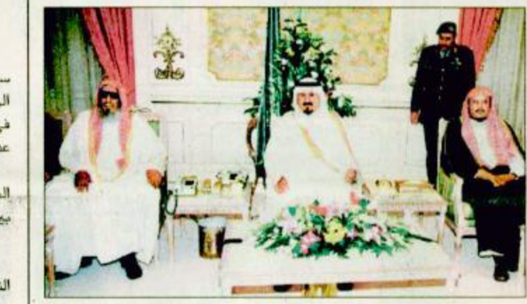
○ الأمير سلطان لدى استقباله مفتي عام المملكة والعلماء

○ جدة-واس: استقبل صاحب السمو الملكي الأمير سلطان بن عبدالعزيز النائب الثاني لرئيس مجلس الوزراء وزير الدفاع والطيران والمفتش العام في مكتبه في الديوان الملكي بقصر السلام بعد ظهر أمس سماحة الشيخ عبدالعزيز بن عبدالله آل الشيخ مفتي عام المملكة ورئيس هيئة كبار العلماء وإدارة البحوث العلمية والإفتاء ومعالي وزير العدل الدكتور عبدالله بن محمد آل الشيخ وأصحاب الفضيلة العلماء رؤساء المحاكم الشرعية بالمملكة. وقد حيا سموه الكريم أصحاب الفضيلة العلماء والشايخ مؤكدا أن لقاءهم لقاء خير وسعادة وأن الخير في الكتاب والسنة. وقال سموه: ونحن على كل حال ولله الحمد والشكر من أيام الملك عبدالعزيز وأجدادنا الأولين وأجدادكم الأولين ونحن على هدي محمد عليه الصلاة والسلام. البقية ص ٣١.