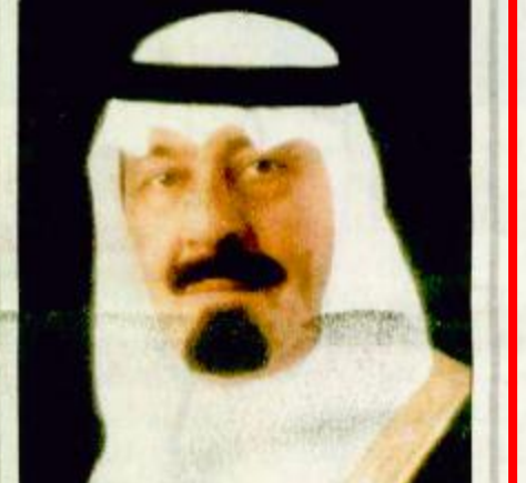
○ الأمير عبدالله بن عبدالعزيز

○ جدة-واس: بعث صاحب السمو الملكي الأمير عبدالله بن عبدالعزيز ولي العهد نائب رئيس مجلس الوزراء رئيس الحرس الوطني برفقة تهنئة إلى صاحب السمو الشيخ حمد بن خليفة آل ثاني أمير دولة قطر بمناسبة ذكرى تولي البقية ص ٣١.