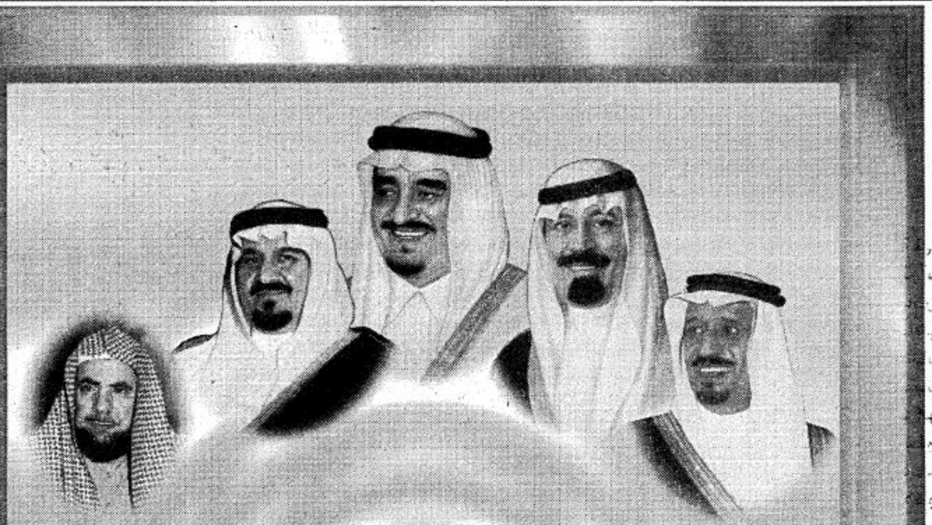
بمناسبة وضع حجر الأساس لمشروع المدينة الأكاديمية لكليات البنات بالرياض يتقدم

وهذه الزيادة المستمرة في أعداد الخريجات من كليات