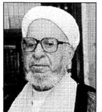
عبد الحميد الخطي

إن شعوري بزيارة صاحب السمو الملكي الأمير عبد الله بن عبد العزيز ولي العهد ونائب رئيس مجلس الوزراء ورئيس الحرس الوطني هو شعور واحد من أكثر من خمسمائة ألف مواطن من هذه المنطقة التي هي جزء من هذه المملكة المزانية الأطراف يتطلعون على الدوام لهذه الزيارة التي تترك أثراً باقياً في أعمق نفوسهم ومشاعرهم واحساسهم بصعب تقييمه في هذه العجالة. إن هذه الزيارة تترك بصماتها على طول المنطقة وعرضها وترقيتها بشوق يفوق التصوير وينق على الوصف. إن لزيارة الآباء لأبنائهم وتحسن ما يصبو له الأبناء من مرود خير على منطقتهم في كل مجالات الحياة أن هذه الزيارة سوف تجسد لصاحب السمو ولي عهدنا الحبيب إخلاص أبناء هذه المنطقة وتلمسه محبتهم الصادقة الخالصة من شوائب اللق والتزلف وسبقوا على كل جبين وفي كل عين من أبناء هذه المنطقة ما يكون لمملكتهم من ولاء ورتوه من أجدادهم وأبائهم منذ فتحت هذه المنطقة صدرها وتلفت صقر الجزيرة للكم عبد العزيز آل سعود يرحمه الله قبل سبع وثمانين سنة وولأولها ما يزال فتيا لم يغيره مر السنين بل ما يزال على فتوته وعنفوان شبابه. وإنني وكل مواطن من أبناء منطقة القطيف لنتقدم إلى ولي عهدنا الغالي بالشكر والامتنان البالغين على هذه الزيارة ونتقدم إليه وأمانينا وأماننا أن يكرر هذه الزيارة لأبنائه الخالصين. وسجد ما لا يستطيع أن يترجمه الحرف مهما أوتي من بلاغة من تلاحم المواطن القطيفي مع حكومته الرشيدة.