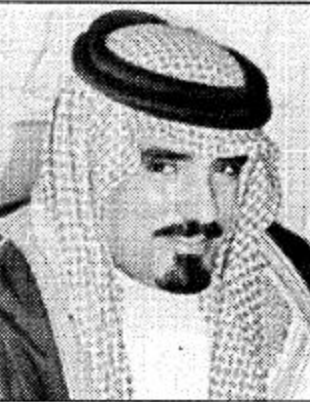
محمد بن عبد الرحمن الشريف

تستقبل المنطقة الشرقية ضيفاً عزيزاً على الجميع حيث سيقوم صاحب السمو الملكي سيدي ولي العهد نائب رئيس مجلس الوزراء رئيس الحرس الوطني الأمير عبد الله بن عبد العزيز آل سعود بزيارة ميمونة لهذه المنطقة وتشتمل زيارة سموه محافظة القطيف حيث سيتفضل سموه الكريم بفتح بعض من الشوارع فيها كمشروع الكورنيش وسيقام استقبال حافل يليق بسموه الكريم إن شاء الله. وتأتي هذه الزيارة الميمونة إدراكاً صادقاً لأهمية هذه المنطقة الغالية من بلادنا الحبيبة من لدن سموه الكريم وبهذه المناسبة يسرني إصالة عن نفي مشرفي المحافظة ونيلية عن أهاليها أن يكون لنا شرف استقبال سموه بالقطيف مرحبين بسموه أجمل ترحيب متمنين لسموه طيب الإقامة بأعين الله عز وجل إن يطول في عمر سموه. أمين المزيد من العطاء الخير لأبناء هذه المنطقة في ظل راند النهضة مولاي خادم الحرمين الشريفين للكم الفتي هدهد بن عبد العزيز آل سعود حفظه الله.