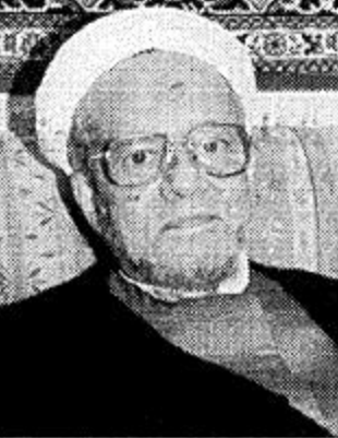
الشيخ / عبدالله الخنيزي