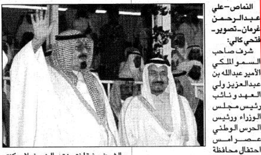
الخلافة والمناخ الجميل، وتوج ذلك بتاج حكمك العادل، الذي أرسى دعائمك جلالة الملك العادل عبدالعزيز طيب الله ثراه وأسكنه فسيح جناته وأشاد بصروحته العالمة ابنائه البورة من بعده، حتى أصبحنا اليوم، و