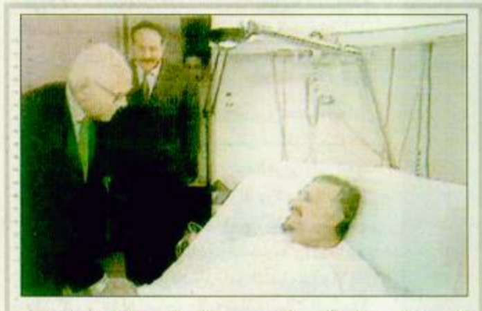
السلطان قابوس والرؤساء كليتوتون ومبارك وصالح يهنئون الأمير سلطان جنيف - ومن: أطمأن جلالة السلطان قابوس ابن سعيد سلطان عمان الشقيقة في اتصال هاتفي اجراه أمس مع صاحب السمو الملكي الأمير سلطان بن عبدالعزيز النائب الثاني لرئيس مجلس الوزراء ووزير الدفاع والطيران والمفتش البيعة، ص ٢٧

وكيل تعليم البنات المساعد للتخطيط والتطوير لـ «الجزيرة»: ٥٦ مليارا تم إنفاقها على تعليم البنات في سنوات الخطة، تخرج منهن مليون و٩٧ ألف طالبة