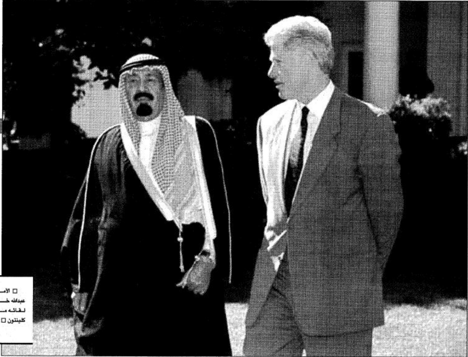
الأمير عبدالله خلال معاينة كلينتون

سمو ولي العهد في حديث ضاف وشامل للزميلة عكاظ :