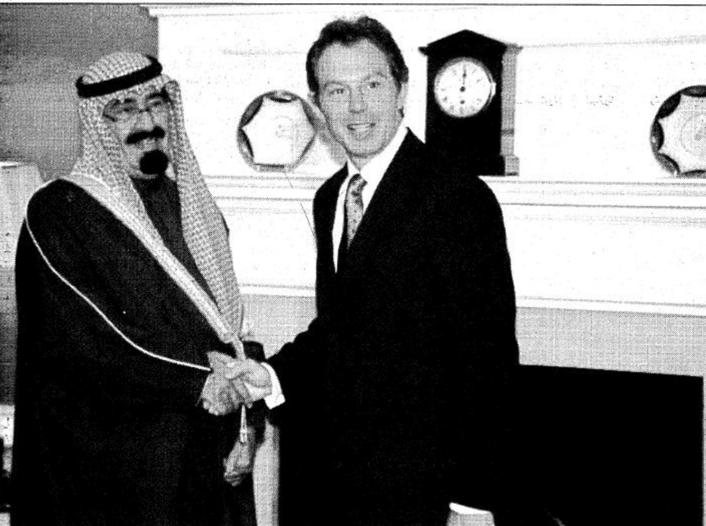
سمو ولي العهد يصافح بلير

العملية السلمية أفضل من لاشيء لأن الأمة ليست مستعدة لاستمرار حالة الاستنزاف وعلى المسؤولين وبالأخص رئيس الوزراء أن يتحمل بالحكمة والتعقل ويتفهم ضرورة للضي في طريق السلام والأمن على الأمم والشواهد التي اقترتها الشرعية الدولية وفي مقدمتها القرارات 242 و 243 وعلى أساس الأرض مقابل السلام لأن الأمن غير ممكن التحقيق في ظل غياب السلام ولأن الضغوط على الجانب الفلسطيني لن تحقق إلا المزيد من حالة التطور والانفجار وبالتالي لن يسهم في تحقيق الأمن الذي تطالب به إسرائيل لاسيما وأن الأمن مطلب مشترك يطالب به الفلسطينيون كما يحتاج إليه الإسرائيليون كما أن السلام ضرورة حتمية يحتاجها الإسرائيليون أكثر من غيرهم.