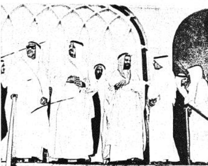
● سمو الامير سلطان وسمو امير المنطقة ومعال وزير الواسلات بانتظار وصول جلالته الملك ●

القضايا العادلة لمختلف الشعوب والامم . جلالته الملك فيصل ابن عبد العزيز تقصد الله برحمته واسكنه فسح جناحه الا انه ما خفف مصابيح ان اسند الامر الى صاحب الجلالة الملك خالد يساعده وبعضه سمو ولي عهده الامين فهد بن عبد العزيز على حمل هذا العبء الكبير واداء رسالة الخير التي حمل لواءها جلالته الملك عبد العزيز ومن بعده جلالته الملك الراحل فيصل بن عبد العزيز . وقال فضيلته ٠٠ واليوم تمنى الراية لخير خلف لخير سلف جلالته الملك خالد المعظم . واضاف بان ابننا المنطقة الشرقية وجميع المواطنين بل وكل الناس يعرفون مكرمات هذه الاسرة الكريمة العريقة في نفوسهم حب الخير والتفاني فيهم حبه لشعبهم ولكافة المسلمين وان مما يدل على ذلك اهدؤوا آكادير القضاء الذي يعتبر مكرمة من مكارم حكومة جلالته الملك المعظم كما تدل على مدى عنق الايمان بالدين والاهتمام بشئون اهله والمشرفين بالعمل تحت لوائه مما ابهج