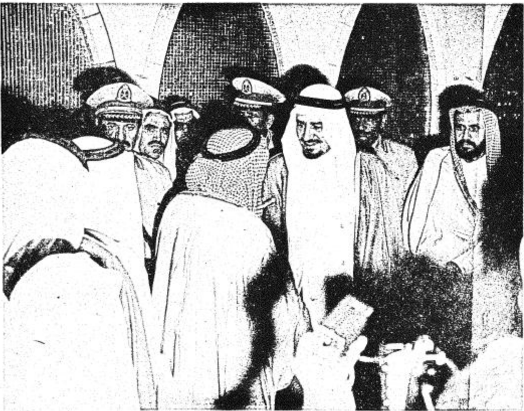
● جلالته داخل صالة الاستقبال بمطار الظهران ●

المنطقة الشرقية الأمير عبد المحسن بن جلوي، وعدد من اصحاب السمو وكبار المسؤولين من مدنيين وعسكريين وجموع محتشدة من المواطنين