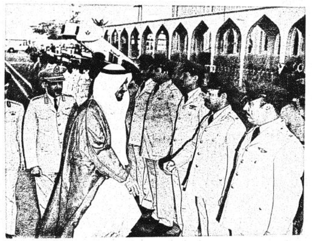
● استقبال الملك العسكري لجلالته بمطار الظهران ●