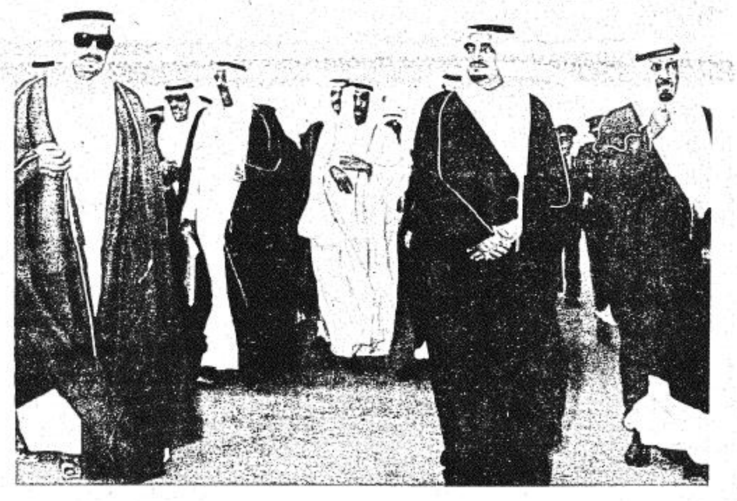
● سمو ولي العهد لحظة وصوله مطار الظهران الدولي ●

القضايا العادلة لمختلف الشعوب والامم . جلالته الملك فيصل ابن عبد العزيز تقصد الله برحمته واسكنه فسح جناحه الا انه ما خفف مصابيح ان اسند الامر الى صاحب الجلالة الملك خالد يساعده وبعضه سمو ولي عهده الامين فهد بن عبد العزيز على حمل هذا العبء الكبير واداء رسالة الخير التي حمل لواءها جلالته الملك عبد العزيز ومن بعده جلالته الملك الراحل فيصل بن عبد العزيز . وقال فضيلته ٠٠ واليوم تمنى الراية لخير خلف لخير سلف جلالته الملك خالد المعظم . واضاف بان ابننا المنطقة الشرقية وجميع المواطنين بل وكل الناس يعرفون مكرمات هذه الاسرة الكريمة العريقة في نفوسهم حب الخير والتفاني فيهم حبه لشعبهم ولكافة المسلمين وان مما يدل على ذلك اهدؤوا آكادير القضاء الذي يعتبر مكرمة من مكارم حكومة جلالته الملك المعظم كما تدل على مدى عنق الايمان بالدين والاهتمام بشئون اهله والمشرفين بالعمل تحت لوائه مما ابهج