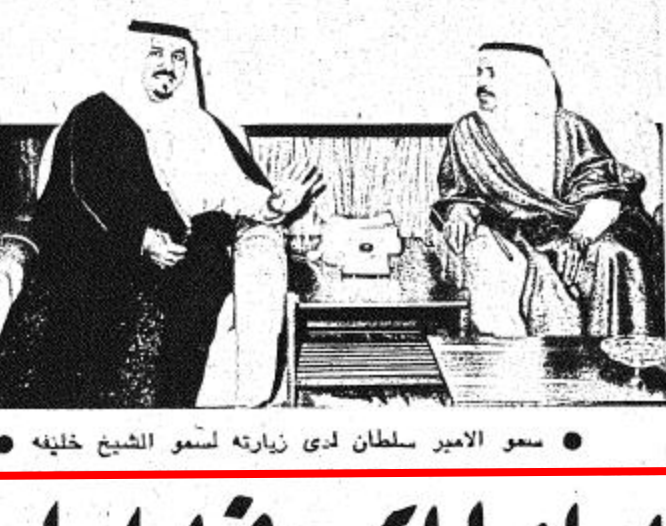
● سمو الامير سلطان لدى زيارته لسمو الشيخ خليفة