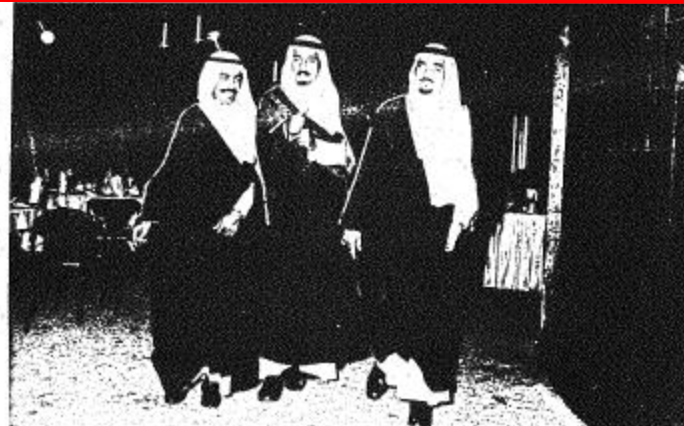
● لفتان من حفل العشاء الذي