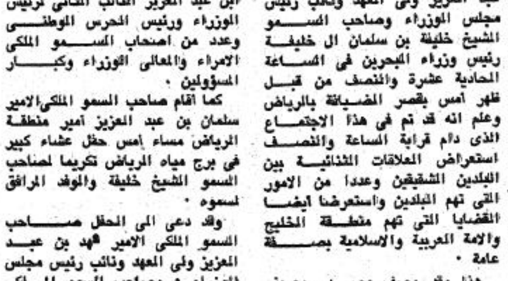
لظة من حفل العشاء الذي اقامه جلالة الملك تكريماً لسمو رئيس وزراء البحرين

هذا وقد وصف مصدر بحريني في حديث لوكالة الأنباء السعودية بزيارة سمو رئيس الوزراء الشيخ خليفة بن سلمان آل خليفة للمملكة بأنها تهدف إلى تحفيز ما فيه خير البلدين بصلة خاصة والمنطقة والعالم العربي والإسلامي بصلة عامة • وقال ان نتائجها ستكون ايجابية وناجحة باذن الله • والفداه بالعلاقات القائمة بين البلدين وبوصفها بأنها قوية وعميقة وقال ان عمقها واصالتها أكبر من أي وصف فهي قائمة على أسس متينة من الإضواء المتزج بروح الإسلام الخشنة وأعرب المصدر عن أمه في أن تزداد هذه العلاقات توطأ وتوسخا لتحقيق ما فيه خير الأمة العربية والإسلامية جماع •