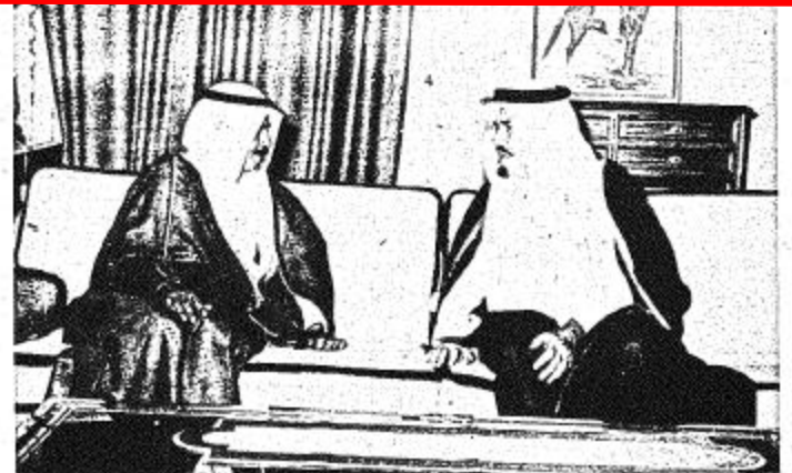
● سمو رئيس وزراء البحرين لدى زيارة سمو الامير محمد