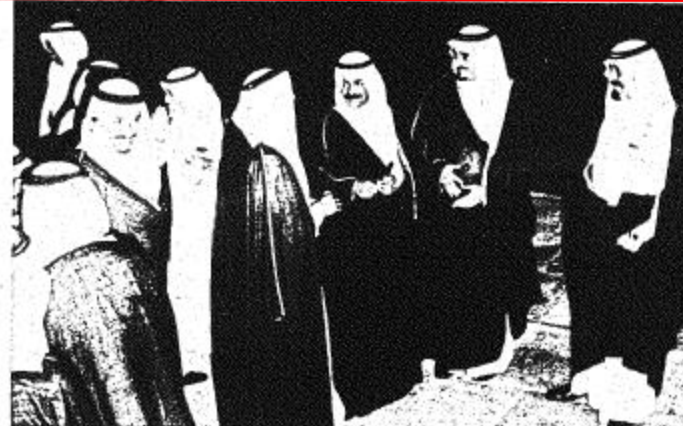
● اقامة سمو الامير سلمان على شرف ضيف الجلال