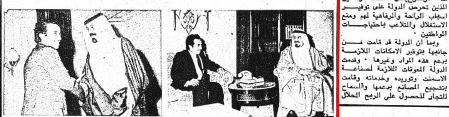
• وزير خارجية اليمن الديمقراطية • وزير خارجية جمهورية اليمن الديمقراطية الشعبية لدى مقابله لسمو الامير عبد الله • الشعبية لدى مقابله لجلالة الملك