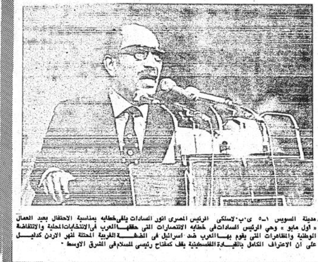
مدينة السويداء - ي.ب. لاسكي الرئيس المصري انور السادات يلقي خطابه بمناسبة الاحتفال بعيد العمال « اول مايو » وحى الرئيس السادات في خطابه الانتصارات التي حققها العرب في الانتخابات المحلية والانطلاقة الوطنية والظواهر التي يقوم بها العرب ضد اسرائيل في الضفة الغربية المحتلة لهدم الاردن كدليل على ان الاعتراف الكامل بالقيادة الفلسطينية يكف مفتاح رئيسي للسلام في الشرق الاوسط.

الملك حسين يستقبل بعثة عسكرية امريكية عمان في ٢٥ - واف استقبل الملك حسين ملك الأردن بعثة عسكرية امريكية من القوات الجوية الامريكية يقوم بزيارة للاردن منذ الخميس الماضي. وقد حضر المقابلة اللواء زيد بن شاكرا القائد العام للقوات المسلحة الاردنية وتوماس بيكرينج سفير الولايات المتحدة بعمان. وقد قام الوفد الامريكي صباح اليوم بزيارة لقاعدة جوية اردنية. مصرع ١٤ باكستانيا في ايران طهران في ٢ مايو واف : ذكرت الصحف الصادرة في طهران اليوم ان اربعة عشر من الباكستانيين لقوا مصرعهم يوم الاربعاء الماضي اثر وقوع التصادم في فندق في زاهدان بالقرب من الحدود الباكستانية. ومما يذكر ان هذا الفندق ملك لاجد الباكستانيين وكان يقيم فيه الباكستانيين الذين جاءوا لمشاهدة معالم ايران ولم يعرف سبب الاصطدام الذي اتى على القسطن بكامله.