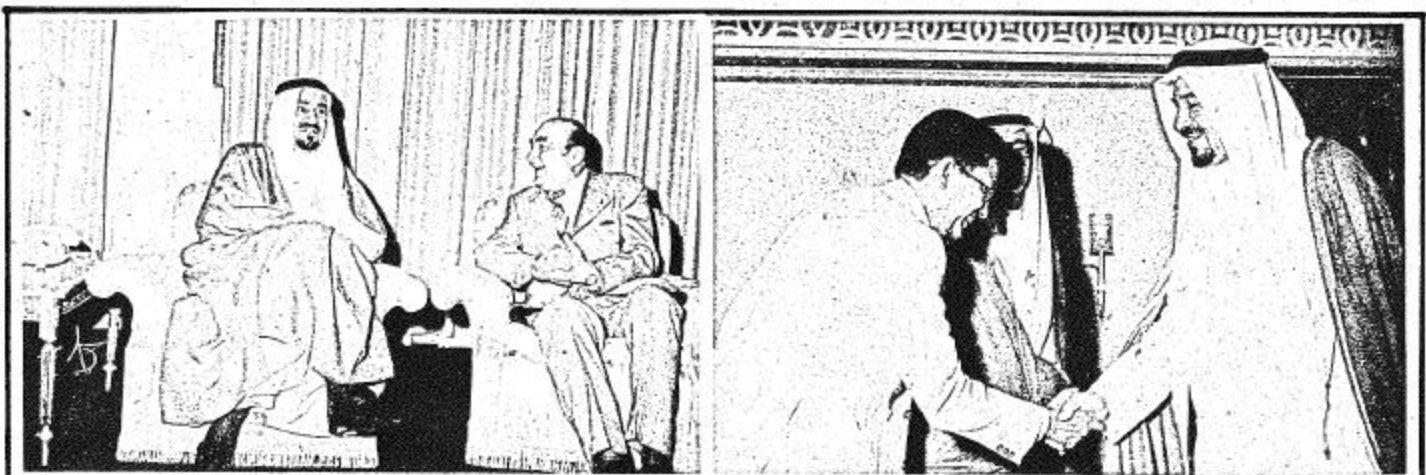
• وزير الشؤون الخاصة برئاسة جمهورية السودان لدى مقابله لجلالة الملك • اسعد الاسعد لدى مقابله لجلالة الملك

وزير الداخلية والتجارة يجتمع اليوم لوضع الترتيبات الفورية لتنفيذ القرار الرام والقول الذي لا يصل إلى حد الاستغلال والبيع وأضرب معاليه ولقد ناقش المجلس توفير الاسمنت للاسواق واستغلال بعض التجار من شغاف التهرب من اجازات المواطنين وأعلن معالي الدكتور محمد عبيد يماني بأن المجلس قرر إيقاف المستغلين عن حدهم وعدم السماح لأي تاجر أو أي شخص باستغلال حاجات المواطنين ولذلك فقد قرر توقيع صاحب السمو الملكي وزير