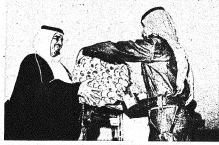
عد من اصحاب السمو الازراء الذين حضروا الاحتفال • وفي العهد يسلم اخذ قادة المجموعات شهادة التخرجين

سمر وطى الصبر والامانة سعى مسرع أن يفتش خطوات الررس الوطنى الذى يقبىر مضرة من المفاخر التى أسسها المشهيد فى صل بن عبد العزيز سوا المات اساك الررس بحسب الرز اولمى بشهرات هالة الملك وعمه وحكمه لمرئىك المهر لخصم اوضاع ابناء المملكة