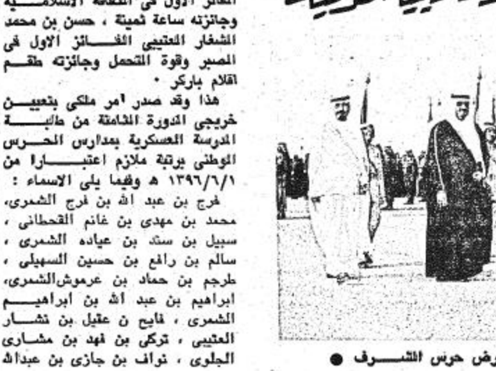
• الامير فهد يستعرض حرس الشرف

الحارثى - محمد بن عبد الله بن سعيد بن هبيل الشهرانى ، مانع بن عمر بن سلطان العتيبي ، فالح بن خاتم بن سعد العتيبي ، محمد بن خالد بن محمد الشهري ، عبد الله بن عيسى العزيبي ، محمد بن عبد الله بن محمد بن سليمان السويلم ، فهد بن ناصر بن عبد الله العريفي ، جلال بن محمد جعل القحطاني ، سلطان بن محمد بن عبد العزيز الشنقي ، عبد الله بن محمد بن عبد الرحمن الصالح ، بندر بن محمد بن نزار الحري ، عيسى بن محمد بن سلطان بن شعار الربيعان ، عبد الله بن محمد بن عبد الله الزمان ، منصور بن خليل بن عمر القحطاني ، تركي بن عبد العزيز بن طيف الله العتيبي ، محمد بن عبد العزيز بن عبد الله الشيخ ، فهد بن سعد بن محمد الربيعان ، عبد الله بن عيسى الرحمن بن صالح القارس ، حسن بن عبد الرحمن بن عبد الله الشهري ، عبد الله بن خالد بن عبد الله العتيبي ، براك بن نبال بن سعد المسيبي ، مناحي بن نايف بن مناحي الربيعان ، ابن محمد القوطة ، فارس بن عياد المحلم العنزي ، فهد بن عبد العزيز المبارك ، شيدان بن حذوك بن عيسى ابن العجمي ، مناحي بن مسفر بن ابن محمد بن مناحي الهضيل ، ناصر بن محمد بن حسين السليهي ، ناصر بن عبد الكريم بن منقول المنديل ، ابن زيد الكثير ، سليمان بن عبد الرحمن بن عبد العزيز العنزي ، سلطان بن حمود بن شامان العنزي •