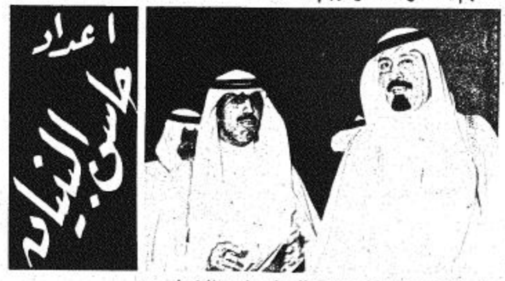
• الامير عبد الله يتحدث للزميل حسان البهيان

• كان أمس موعد - العهد - مع يوم الرجولة في الحرس الوطنى ، ومسيرة جديدة في تخريج الابطال الذين ملأ صدورهم عبق زهور الصحراء ولوحث وجوههم شمس الوطن الغالى • لقد قال عنهم فهد بن عبدالعزيز ( للجزيرة ) يوم أمس نهم مفرقة نعتز بهم ••