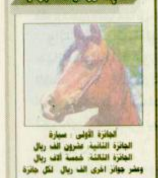
انفجار الفوس سارة الطيرة التفتحة طرون لله ريال الطيرة التفتحة خمسة لله ريال وعشر جوار اخرى لله ريال لكل خفرة