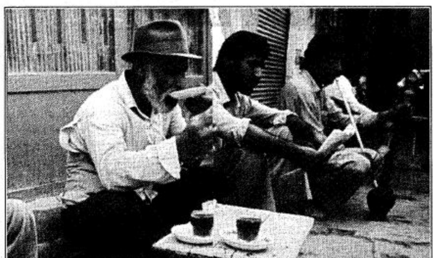
تقاضي البيطلة في إيران

واما التقوير الثامن عن القوة الايرانية الموجودة في جزر النطن وادوموس، والتي اخذت تصريح رئيس الركان الامريكي الجنرال جون شاليكاشفي بشأن، فبشرها، في فبراير الفائت كانت عليه قبل عدة متزايدة، لم تعد تراجعا في برنامجها اشهر. وهناك عدد كبير من الدبابات والمضخات وناقلات الجنود التي ارسلت الى تلك الجزر، تقع الان في السوتواعا، فيما انخفض عدد جنود تلك القوة من اربعة الاف الى ثلاثة.