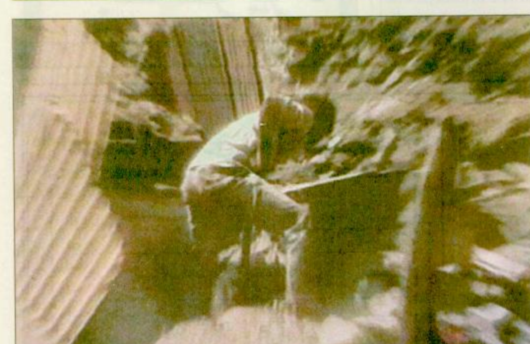
أثار الهزة الأرضية الثانية في ايلات «صورة تلفزيونية»