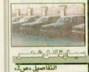
تسارح كمال هجر التفاصيل ص ٢٨