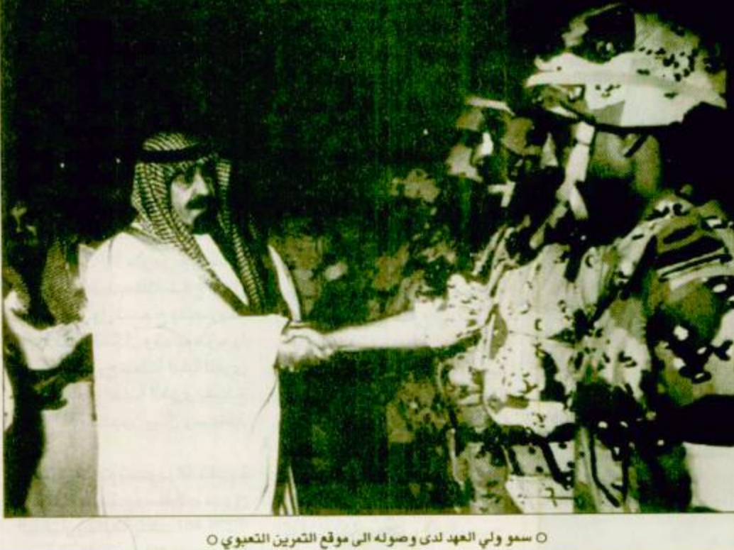
سمو ولي العهد لدى وصوله الى موقع التمرين التعبوي

بريدة - عبدالعزيز الدياسي - مخيم التمرين التعبوي - واس: يرعى صاحب السمو الملكي الأمير عبدالله بن عبدالعزيز ولي العهد ونائب رئيس مجلس الوزراء ورئيس الحرس الوطني اليوم فعاليات اختتام التمرين التعبوي السنوي الكبير «نصر من الله» الذي تنفذه وحدات قوات الحرس الوطني. وكان الحرس الوطني بدأ توريته السنوي «نصر من الله» يوم الخميس قبل الماضي، خارج مدينة الرياض. مستخدماً فيه الذخيرة الحية. وقد دعى إلى مشاهدة اختتام التمرين عدد من أصحاب السمو الملكي الأمراء وعدد من كبار الشخصيات العسكرية والمدنية في المملكة. وأوضح صاحب السمو الملكي الفريق ركن متعب بن عبدالله بن عبدالعزيز نائب رئيس الجهاز العسكري بالحرس الوطني وقائد كلية الملك خالد العسكرية وقائد تمرين «نصر من الله»، أوضح أن رعاية سمو ولي العهد فعاليات هذا التمرين وتشريفه أبناءه ضباط وجنود الحرس الوطني بحضوره ومشاهدته المراحل النهائية للتمرين وتقديم توجيهاته الكريمة لهم، تأكيداً لحرص سمو ولي العهد على أن تلقى الكفاءة القتالية لقوات الحرس الوطني في أعلى مستوياتها، وتكون في مستوى طموحات خادم الحرمين الشريفين في ترقية وتطوير قدراتنا الدفاعية بصورة مستمرة. جدير بالذكر أن قوات الحرس الوطني بدأت إجراءات التمرين التعبوي والمناورات العسكرية عام 1399، وكان «فاتح الخير» أول تمرين تعبوي تجريه، وبعد ذلك توالت التمرينات السنوية تحت مسعيات مختلفة ومنها تمارين «شروق الشمس»، «البيعامة»، «نجد»، «العرين»، «الجدة»، «العدل» و«السلام»، «القيادة والاتصالات»، «التوحيد».