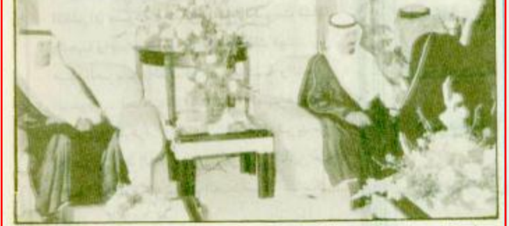
استقبل صاحب السمو الملكي الأمير سلطان بن عبدالعزيز ولي العهد ونائب رئيس مجلس الوزراء ورئيس المجلس الأعلى للحريات

سمو ولي العهد يستقبل العلماء والسياسيين والمواطنين