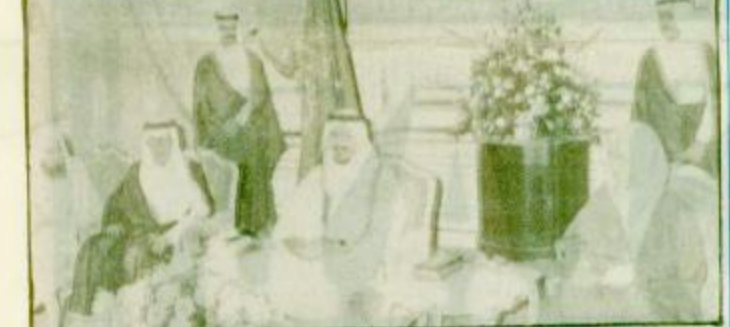
استقبل صاحب السمو الملكي الأمير نايف بن عبدالعزيز النائب الثاني لرئيس مجلس الوزراء ووزير الدفاع