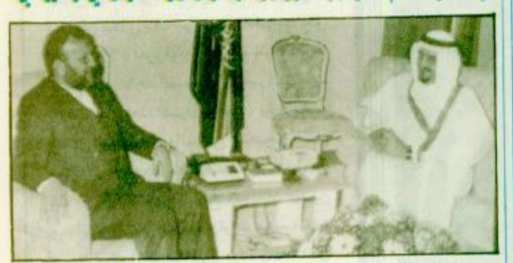
استقبل خادم الحرمين الشريفين - حفظه الله - في مكتبه بقصر السلام الملك فهد بن عبدالعزيز آل سعود.

استقبل رئيس وزراء باكستان رسلان نظام الحرمين الشريفين من الرئيس الكويتي والي