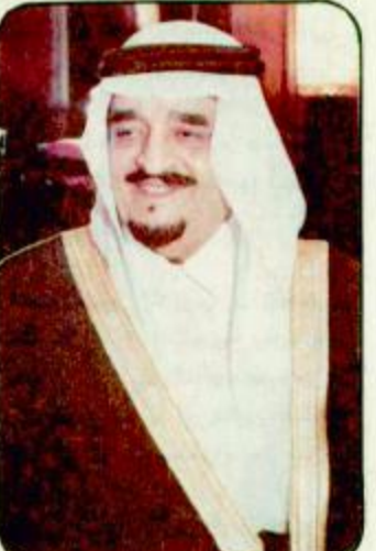
خادم الحرمين الشريفين يتلقى برفقة شكر من رئيس سيشل