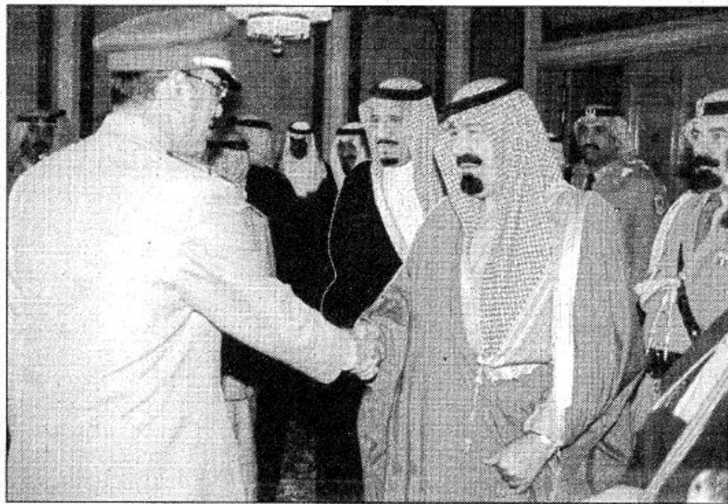
لقطتان من مغادرة سمو ولي العهد الرياض الى اسلام اباد