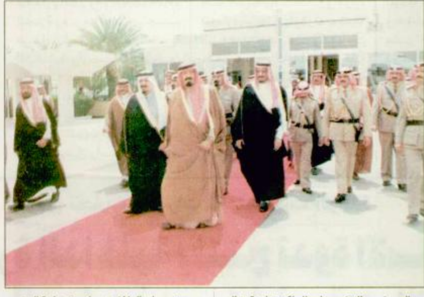
وعند سلم الطائرة صافح فخامة الرئيس فاروق ليجاري أخاه صاحب البقية «ص33»

اسلام اباد - الرياض - واس نيابة عن خادم الحرمين الشريفين الملك فهد ابن عبدالعزيز آل سعود وصل بحفظ الله ورعايته صاحب السمو الملكي الامير عبدالله ابن عبدالعزيز ولي العهد ونائب رئيس مجلس الوزراء ورئيس الحرس الوطني الى اسلام اباد مساء أمس ليرأس وفد المملكة العربية السعودية الى مؤتمر القمة الاسلامية الاستثنائية الذي يبدأ أعماله اليوم الاحد في العاصمة الباكستانية. وكان فخامة الرئيس فاروق احمد خان ليجاري رئيس جمهورية باكستان الاسلامية ودولة رئيس الوزراء محمد نواز شريف في استقبال سمو ولي العهد بمطار اسلام اباد الدولي. وقد جرى لصاحب السمو الملكي الامير عبدالله بن عبدالعزيز استقبال رسمي بالمطار. فلدَى توقف الطائرة للقمة لسموه سعد اليها