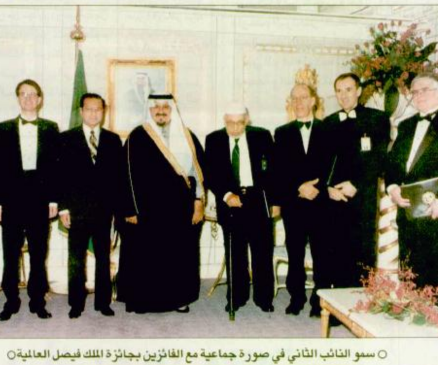
سمو النائب الثاني في صورة جماعية مع الفائزين بجائزة الملك فيصل العالمية

كتب محمد العبدروس وصالح الفالح: نيابة عن خادم الحرمين الشريفين الملك فهد بن عبدالعزيز آل سعود رعى صاحب السمو الملكي الامير سلطان ابن عبدالعزيز النائب الثاني لرئيس مجلس الوزراء وزير الدفاع والطيران والمفتش العام مساء أمس السبت في مركز الخزامي بالرياض حفل تسليم جائزة الملك فيصل العالمية التاسع عشر لهذا العام 1417هـ 1997م. وقد وصف صاحب السمو الملكي الامير سلطان بن عبدالعزيز النائب الثاني لرئيس مجلس الوزراء وزير الدفاع والطيران والمفتش العام، مؤسسة الملك فيصل الخيرية بأنها مؤسسة الخير والعلم والعرفه والمجبة وكل عام لها مجال وصولات وجولات لخدمة الاسلام والعلم. (تغطية كاملة للحفل ص 10 و 11) البقية «ص33»