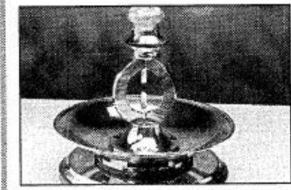
ملحق خاص بمناسبة كأس ولي العهد الأمير عبدالله ابن عبدالعزيز