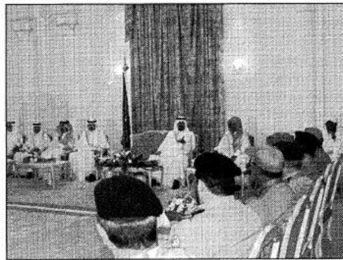
لقطات من استقبال سمو النائب الثاني لرئيس مجلس الوزراء