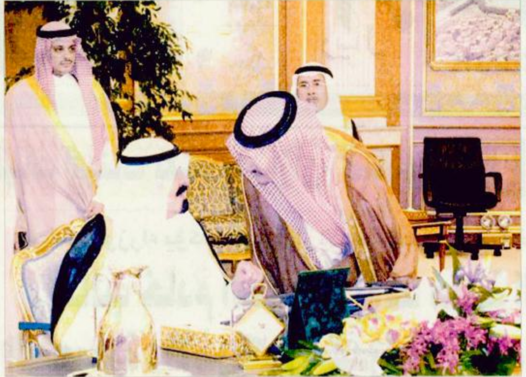
نائب خادم الحرمين يترأس جلسة مجلس الوزراء

لاستكمال الاجراءات النظامية. ثانياً: بعد الاطلاع على مشروع اتفاق تعاون بين حكومة المملكة العربية السعودية وحكومة جمهورية جنوب أفريقيا في مجال الرياضة المرفوع من صاحب السمو الملكي الرئيس العام لرعاية الشباب قرر مجلس الوزراء تفويض سموه أو من ينوبه بالتوقيع على مشروع الاتفاقية المشار إليها في ضوء الصيغة المرفقة بالقرار ومن ثم رفع النسخة النهائية الموقعة لاستكمال الاجراءات النظامية. ثالثاً: بعد الاطلاع على مشروع برنامج التعاون الفني بين وزارة التجارة بالمملكة العربية السعودية والمصلحة الوطنية لرقابة الجودة والاختيار والحجر الصحي في جمهورية الصين الشعبية قرر مجلس الوزراء تفويض معالي وزير التجارة أو من ينوبه بالبحث مع الجانب الصيني لإعداد مشروع برنامج التعاون المشار إليه في ضوء الصيغة المرفقة بالقرار والتوقيع عليه وذلك في إطار اللجنة المشتركة