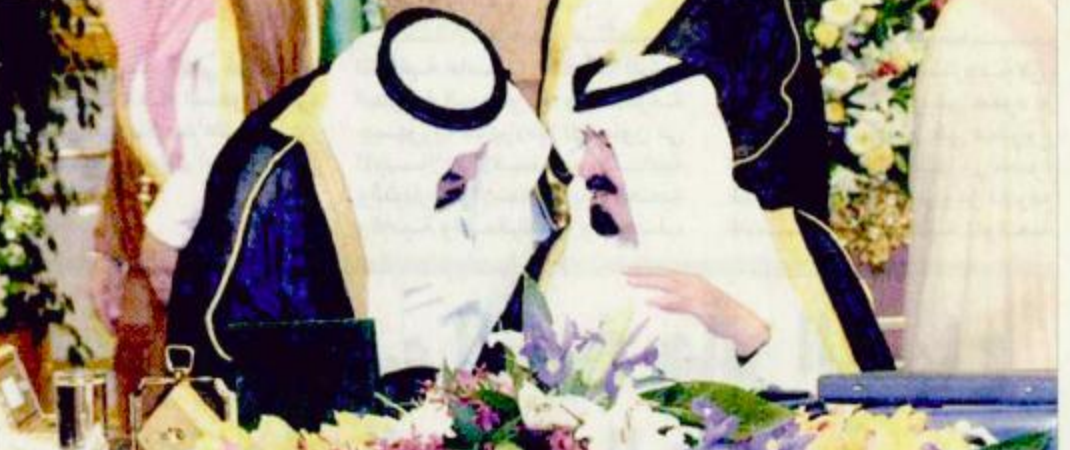
نائب خادم الحرمين وسمو النائب الثاني خلال اجتماع مجلس الوزراء

أكد صاحب السمو الملكي الأمير عبدالله بن عبدالعزيز نائب خادم الحرمين الشريفين - حفظه الله - لدى ترؤسه جلسة مجلس الوزراء متانة العلاقات بين المملكة العربية السعودية والولايات المتحدة الأمريكية وروسخها واصفا إياها بأنها علاقات تاريخية تقوم على الاحترام المتبادل والمصالح المشتركة والسعي إلى تحقيق الاستقرار والسلام والعدل في العالم وفق الاعراف والقوانين الدولية. وأعرب المجلس في هذا الصدد عن تقديره لما صدر عن المسؤولين في الإدارة الأمريكية من تصريحات طيبة ردا على ما أثير بخصوص العلاقات بين المملكة والولايات المتحدة الأمريكية. وشدد سموه على أن جوهر المشكلة وسبب تأجيجها هو استمرار الاحتلال الإسرائيلي للأراضي الفلسطينية ومواصلته أعماله العدوانية ضد الأرض والشعب الفلسطيني وقال إنه بزوال وإنهاء هذا الاحتلال تزول هذه المشكلة. وأكد المجلس أهمية القرار الذي وافقت عليه الجمعية العامة للأمم المتحدة مؤخرا المتضمن الطلب من إسرائيل سحب قواتها فوراً من المدن الفلسطينية لتعود إلى المواقع التي كانت تحتلها قبل بدء الانقراض في سبتمبر من العام 2000م ووقف جميع أعمال العنف. موضحاً أن هذه خطوة نحو انسحاب إسرائيلي كامل من الأراضي الفلسطينية المحتلة. تطلع ص ٢