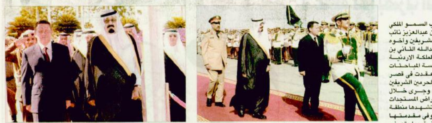
نائب خادم الحرمين الشريفين خلال استقباله للعاهل الأردني