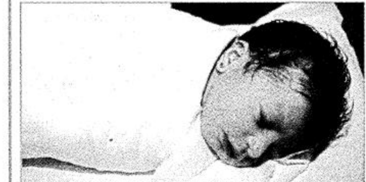
□ الرياض - ياسر المعارك:

بلغ عدد المواليد مساء أمس في ليلة عيد الفطر المبارك «80» مولوداً وذلك في ثلاثة مستشفيات فقط بالرياض وهي مستشفى الحمادي والمستشفى السعودي الألماني بالإضافة إلى مستشفى دلة، الجزيرة، تهنت أهالي المواليد وتدعو الله أن يجعلهم من مواليد السعادة.