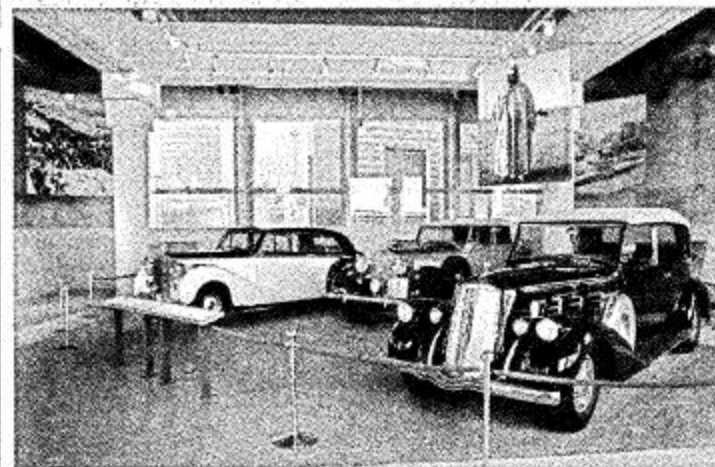
□ الرياض - عبدالرحمن للصبيح:

بشارك مركز الملك عبدالعزيز التاريخي في احتفالات عيد الفطر المبارك التي تنظمها أمانة مدينة الرياض، حيث ستشهد قاعة الملك عبدالعزيز للمحاضرات مهرجان «وناسة» للأطفال والنساء ويشتمل على عروض مسرحية وألعاب حرة ومسابقات وجوائز ويبدأ المهرجان الساعة الرابعة عصراً. كما تشهد الساحات والميادين والطرق المحيطة بالمرکز عدداً من المسابقات الرياضية، يشارك فيها