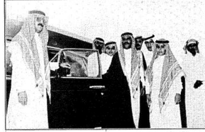
متعب بن شريم وصورة مع بنتلي

الوسط الفروسي لن ينسى جهود بجل وقته في ان يسير هذا النادي نجم هذا الموسم الاول سمو الامير متعب بن عبدالله والذي ضحي