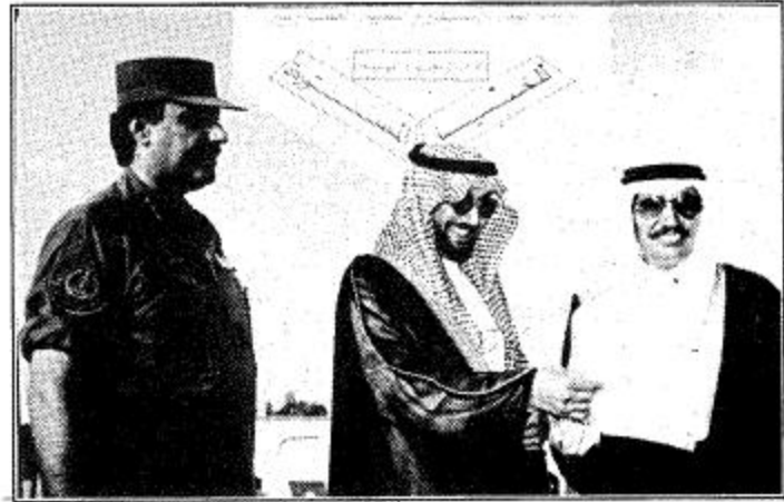
فيحان للتدليل بمجوده القليل لقب جواد الموسم

سليمان هذا الانتصار (الرنان) وشعبية الليل فعلا ما لها مثيل