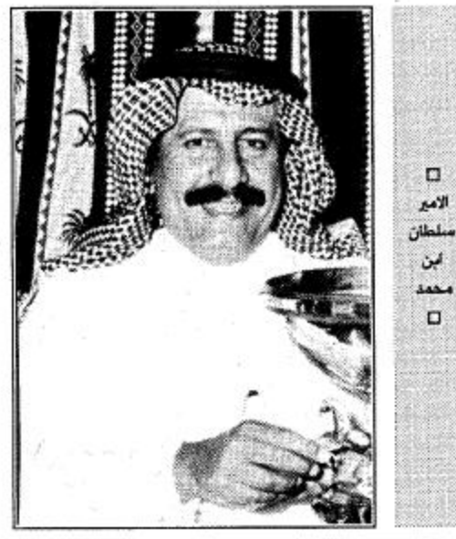
الأمير سلطان بن محمد

في اتصال هاتفني من خارج المملكة هنا صاحب السمو الامير سلطان بن محمد بن سعود الكبير صفحة فروسية الجزيرة «الميدان» عقب فوزها بالمركز الاول على صفحات الفروسية بالصحف المحلية وبارك سمو الامير سلطان بن محمد في اتصاله الهاتفني لمعد صفحة الميدان هذا النجاح مشيراً سموه الى ان هذا ما كان يتحقق لولا الجهد الكبير الذي تقوم به الصفحة في ايصال رسالة الفروسية لقراءها عبر الميدان.. بكل امانة ومصداقية واعطاء كل ذي حق حقه اضافة الى بعدها عن الروتينية وصراحتها المعهودة.. وانها فعلا كانت على اسمها ميدانية تتسابق فيها الافكار والابداعات كما تتسابق جياد السباق في المضمار.