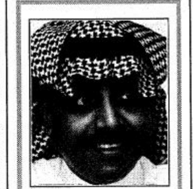
رئيس تحرير الرياضية واشادة نعتز بها كثيرا!!

في ليلة من الليالي الممتعة وتحت اجواء ريفية ممتدة.. جمعت فرس الموسم غنوة اهل الخيل.. ليلة الخميس الماضية في اسطبل مالكةا متعب بن شريم.. على شرف الامير متعب بن عبد الله بن عبد العزيز.. رئيس اللجان الفنية بنادي الفروسية. الشاعر جعيثن محمد الشمري اهدى سموه هذه القصيدة المعبرة.. عرفانا لادوار ابي عبد الله في نجاح فروسية سعودية نحو العالمية: أهلاً بمتعب عدو وبيل الهماليل وما غررد القمري بروس المياني وما مسالت الاغصان بالنود تمثيل ورداً شذاه العود والزعفراني يا مرحباً ترحيبية المسك والهيل يا ملبسي الدعوة لداغيبك عاني ابن شريم اعداد ما يجري النيل يهلي يكم يا مشرفين المكاني الخيل عزاً للرجال الشاكيل قسب الحوافر والفضول الحانسي ان رومن مثل الجميلة زعاجيل بنحورون عمر المسافة ثواني جلمود صخرأ من علي حطه السيل كل الشيبه بينه وبين الحصاني قبل اربعة عشر قرناً ولخيل تفضيل فيها لطلاب الغتام مغاني خيل الصحابة مقفيات ومقابل عند النبي للخيل قيمة وشاني حارب هل الاضتنام واهل الابطاطيل على ظهور الخيل هي والسنانسي في ما بعد للخيل حاجة وتاصيل اعز وانغلي سانة بالزمانسي شعر / جعيثن محمد الشمري