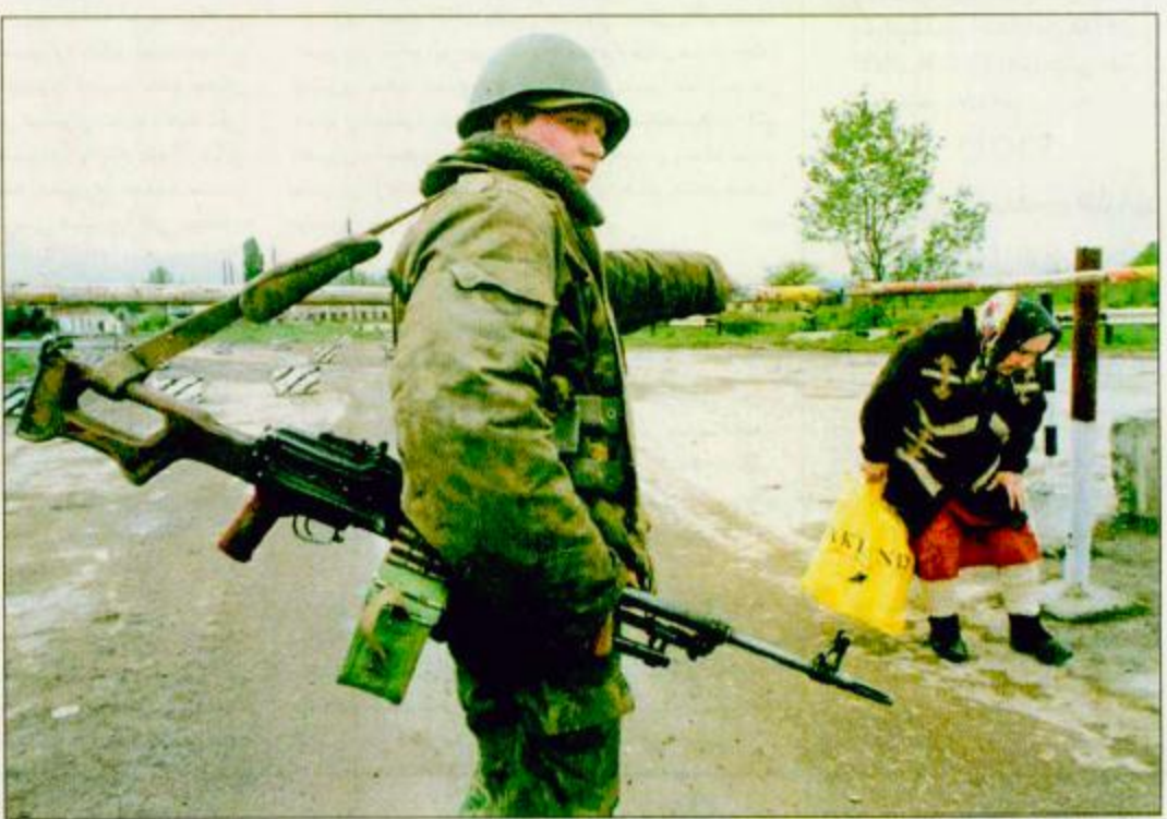
جروزني- الشيشان: جندي روسي يسمح لسيدة شيشانية بالعبور في أحد طرق التفتيش المؤدية إلى جروزني.

معارك ضارية في المناطق الجبلية مقتل ١٦ جندياً روسياً في كمين نصبه المقاتلون الشيشان جروزني- الشيشان: جندي روسي يسمح لسيدة شيشانية بالعبور في أحد طرق التفتيش المؤدية إلى جروزني. الشيشان خسائر جسيمة في معركة ضارية وقعت في المناطق الجبلية جنوب جمهورية الشيشان وقال المتحدث باسم الجيش الروسي وكالة إيتار- تاس للأنباء أن القوات الروسية قتلت 18 مقاتلاً وشردت جماعة من الشيشانيين بعد أن هاجمهم جواً. ولم يعرف وقت وقوع القتال. وذكرت التقارير أن الطائرات والمروحيات الروسية المقاتلة قامت بأكثر من 30 طلعة منذ أمس الأول «الأربعاء» خاصة على مناطق شاروي وتشيبيرلوي الجبلية الجنوبية. وذكر المقاتلون من خلال موقع لهم على الإنترنت أنهم هاجموا 250 جندياً روسياً وقتلوا 25 منهم، وقالوا أن ثلاثة منهم قد قتلوا بينما جرح 15 آخرين. وقد طلبت الوحدات الروسية في المنطقة تعزيزات من المروحيات القتالية.