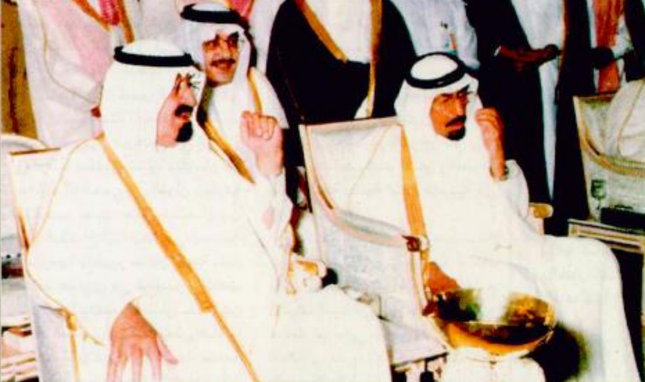
سمو ولي العهد لدى رعايته المباراة الختامية العام الماضي

سمو ولي العهد يرضى المباراة الختامية على كأس سموه بين الهلال والشباب الأمير سلطان بن فهد: الرعاية تأتي تواصلاً وحرصاً من سموه على الالتقاء بأبنائه الشباب والرياضيين تقام اليوم على ملعب رعاية الشباب بجدة.. ودخول الجماهير مجاناً الرياض-واس: يرضى سموه بشيئة الله تعالى صاحب السمو الملكي الأمير عبدالله بن عبدالعزيز ولي العهد نائب رئيس مجلس الوزراء رئيس الحرس الوطني مساء اليوم الجمعة المباراة الختامية على كأس سموه الكريم التي ستقام بين فريقَي الهلال والشباب من الرياض على استاد الرئاسة العامة لرعاية الشباب بمحافظة جدة. ويهدف التنافس عبر صاحب السمو الملكي الأمير سلطان بن فهد بن عبدالعزيز الرئيس العام لرعاية الشباب رئيس الاتحاد السعودي لكرة القدم باسمه ويسمو كافة الشباب والرياضيين في المملكة عن الاعتزاز والفخر بالرعاية الكريمة لصاحب السمو الملكي الأمير عبدالله بن عبدالعزيز «رعاه الله» لهذه المناسبة مؤكداً سموه أن هذه الرعاية تأتي تواصلاً وحرصاً من سموه حفظه الله على الالتقاء بأبنائه الشباب والرياضيين. ملحق خاص بهذه المناسبة ١٣٦ صفحة