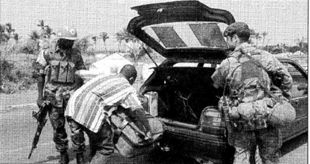
فريتاون-سيراليون: اثنان من الجنود الدوليين في سيراليون يشرفان على عمليات تفتيش في احد الطرق المؤدية الى العاصمة فريتاون.