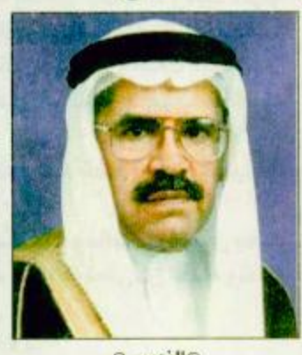
إبراهيم التميمي وزير الطاقة والتعدين الفنزويلي علي روفزيس، وقد عقد الاجتماع هذا من أجل استعراض تطورات وضع السوق البترولية الدولية.

عقب اجتماع لوزراء البترول في الدول الثلاث المملكة والمكسيك وفنزويلا يبدون ارتياحهم لوضع أسواق البترول إبراهيم التميمي وزير الطاقة والتعدين الفنزويلي علي روفزيس، وقد عقد الاجتماع هذا من أجل استعراض تطورات وضع السوق البترولية الدولية ومن أجل تقييم آخر القرارات التي تم اتخاذها بالتعاون مع الدول الأخرى المنتجة للبترول، والتي تهدف إلى ترسيخ الاستقرار في السوق البترولية الدولية. وقد عبر الوزراء المجتمعون عن ارتياحهم للنتائج التي تحققت من زيادة الانتاج التي تم الاتفاق عليها خلال شهر مارس الماضي، فالزيادة في الانتاج أدت إلى إيجاد الاستقرار اللازم للسوق كما أن هذه الزيادة جعلت الأسعار تحافظ على مستوى مقبول. اليقية، ص ٣٣.