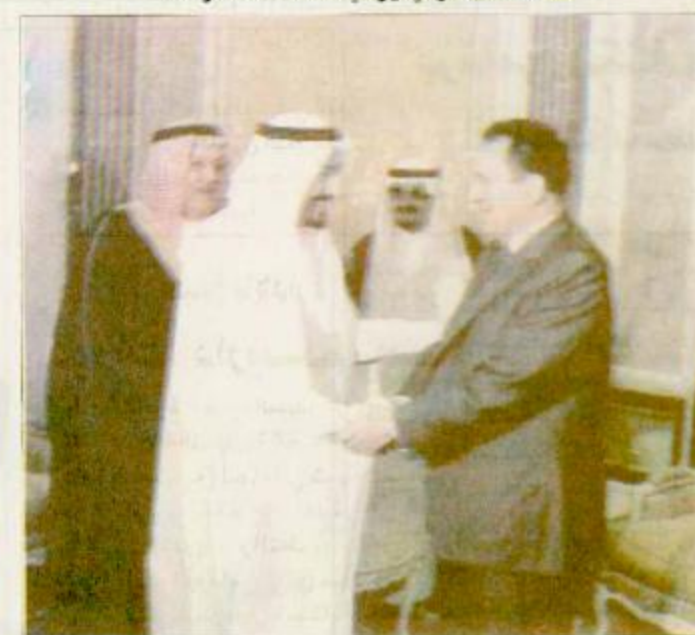
□ سمو الأمير متعب يودع الرئيس المصري □