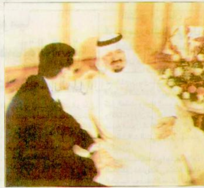
□ سمو الأمير سلطان يتحدث مع أحد أعضاء الوفد الأردني □