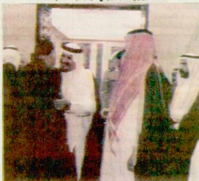
□ سمو النائب الثاني يودع الرئيس حسني مبارك □