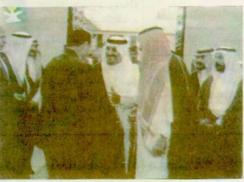
القاهرة / واس عاد الرئيس المصري حسني مبارك الى القاهرة أمس قادما من جدة بعد زيارة للمملكة العربية السعودية استغرقت أربعة وعشرين ساعة. وقد ادى الرئيس مبارك خلال زيارته مناسك العمرة و أجرى محادثات مع صاحب السمو الملكي الأمير عبدالله بن عبدالعزيز ولي