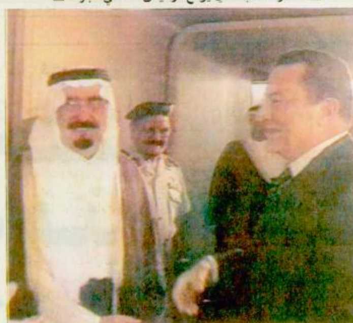
□ سمو أمير منطقة مكة المكرمة يودع الرئيس المصري □