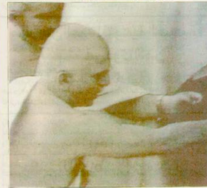
□ العاهل الأردني يؤدي مناسك العمرة □