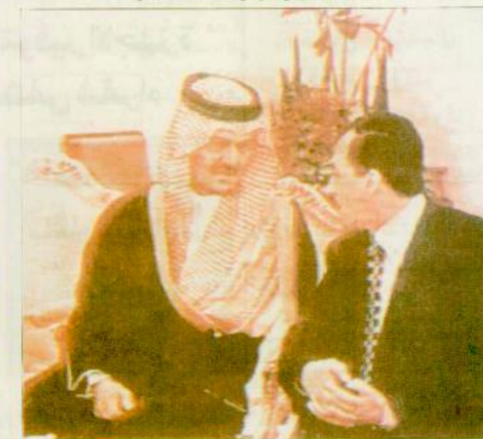
□ سمو الأمير سعود الفيصل يتحدث مع رئيس الوزراء الأردني □