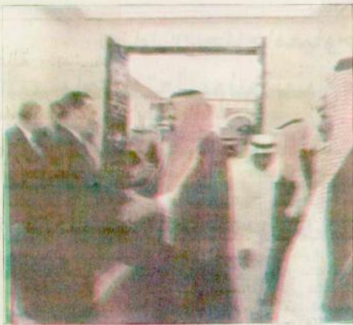
□ سمو ولي العهد يودع الرئيس المصري □

إن ما تحقق في عهد خادم الحرمين الشريفين الملك فهد بن عبد العزيز - رعاه الله - للحرمين الشريفين من توسعة وخدمات مدعاة لفخر أبناء هذه العقيدة الراسخة من مشارق الأرض ومغاريبها، ومنجز تاريخي ستسجله الذاكرة لقيادة المملكة بكل فخر واعتزاز على مر الأيام والسنين.. في هذه الأيام المباركة، تلهج السنة الجميع من زوار أظرف بقاع الأرض بالدعاء لخادم الحرمين الشريفين بطول العمر والمديد من الأيام في خدمة الإسلام والمسلمين.