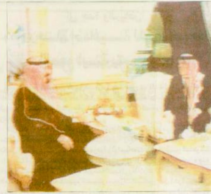
□ سمو ولي العهد أثناء لقائه بجلالة الملك حسين □