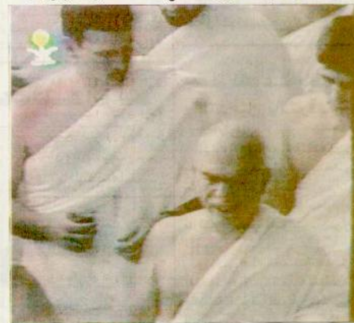
□ العاهل الأردني يؤدي مناسك العمرة □